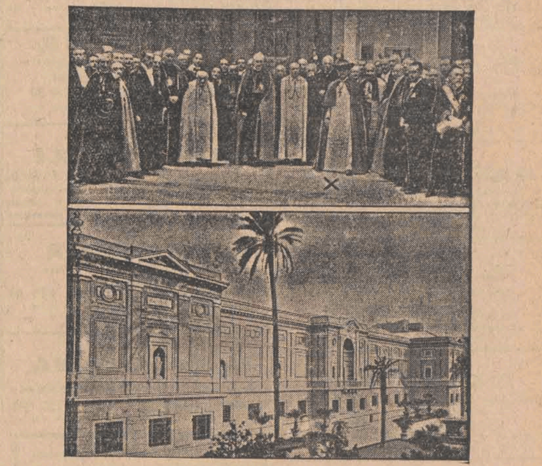
W obecności Ojca Św. odbyło się uroczyste poświęcenie i otwarcie nowozbudowanej galerji sztuki. U góry: Papież Pius XI (x) podczas otwarcia pinakoteki. U dołu: Fronton nowego gmachu.