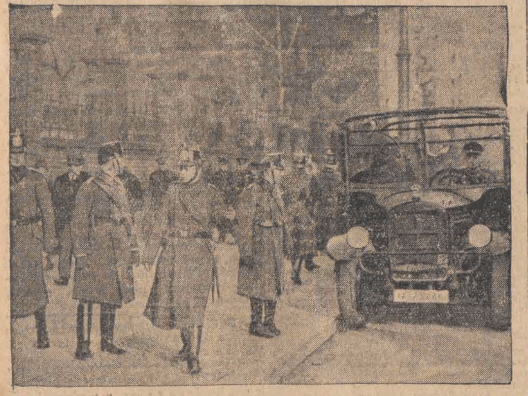
Krwawe walki w Berlinie powtarzają się jeszcze bez przerwy w opanowanych przez komunistów dzielnicach miasta. Pod osłoną policji usiłowały wyjechać na miasto autobusy. Zostały jednak zdemolowane przez strajkujących i bojówki komunistyczne.