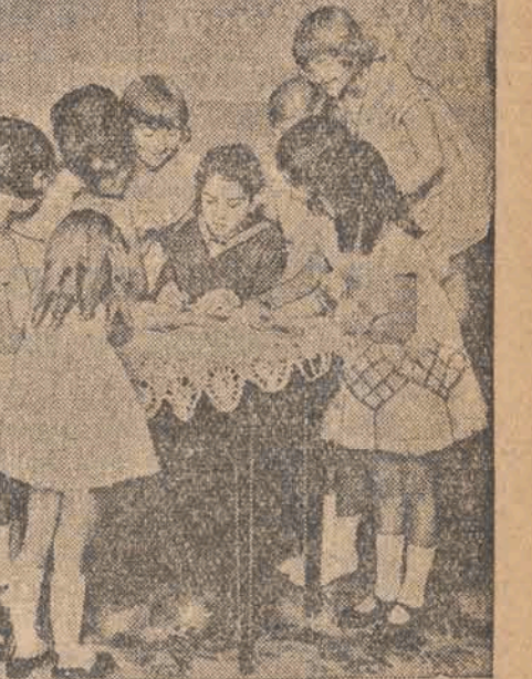
Dziewięcioletni wirtuoz Ruggiero Ricci rozdziela po występie w Budapeszcie swoim rówieśnikom autografy.