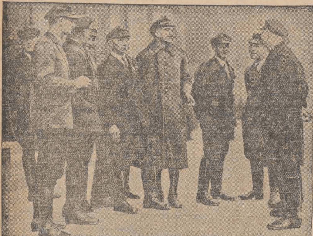
Grupa 40 zamachowców, którzy stanęli przed sądem doraźnym w Altonie, pod zarzutem dokonania szeregu zamachów dynamitowych w Szlezewiku i Holsztynie.