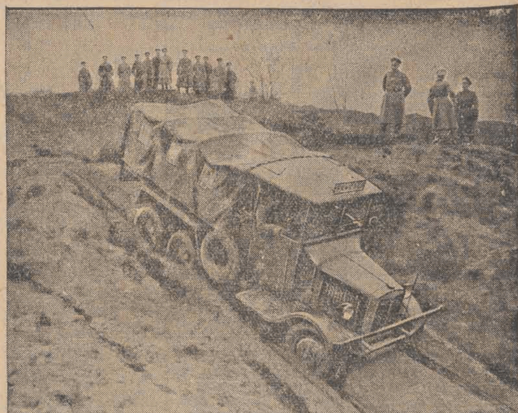
W Döberitz pod Berlinem odbyły się ćwiczenia jazdy nowych samochodów ciężarowych Reichswehry, które pokonywały wszelkie nierówności terenu i bezdroża.