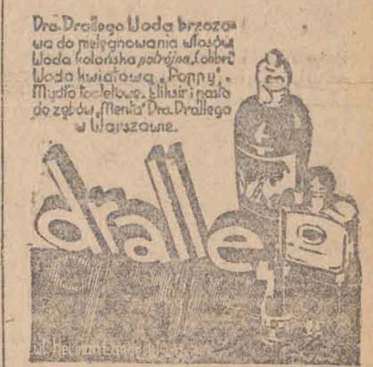
Dra Dalego. Woda brzoza... (text describing the product)