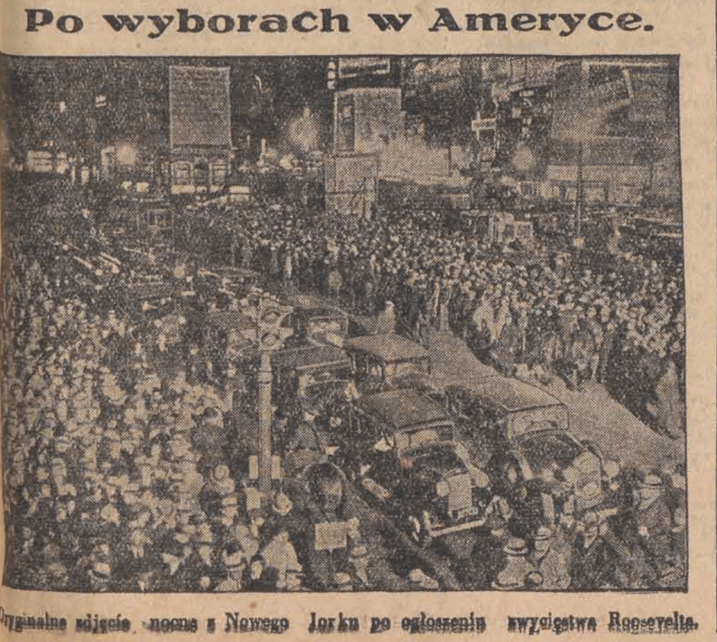
Po wyborach w Ameryce.