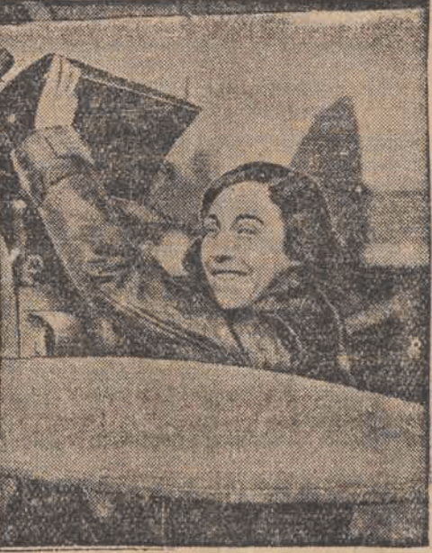
Amy Johnson - Mollison przebyła trasę Londyn-Kapsztadt, w znakomitym czasie bijąc rekord swego męża o 10 godzin 30 minut.