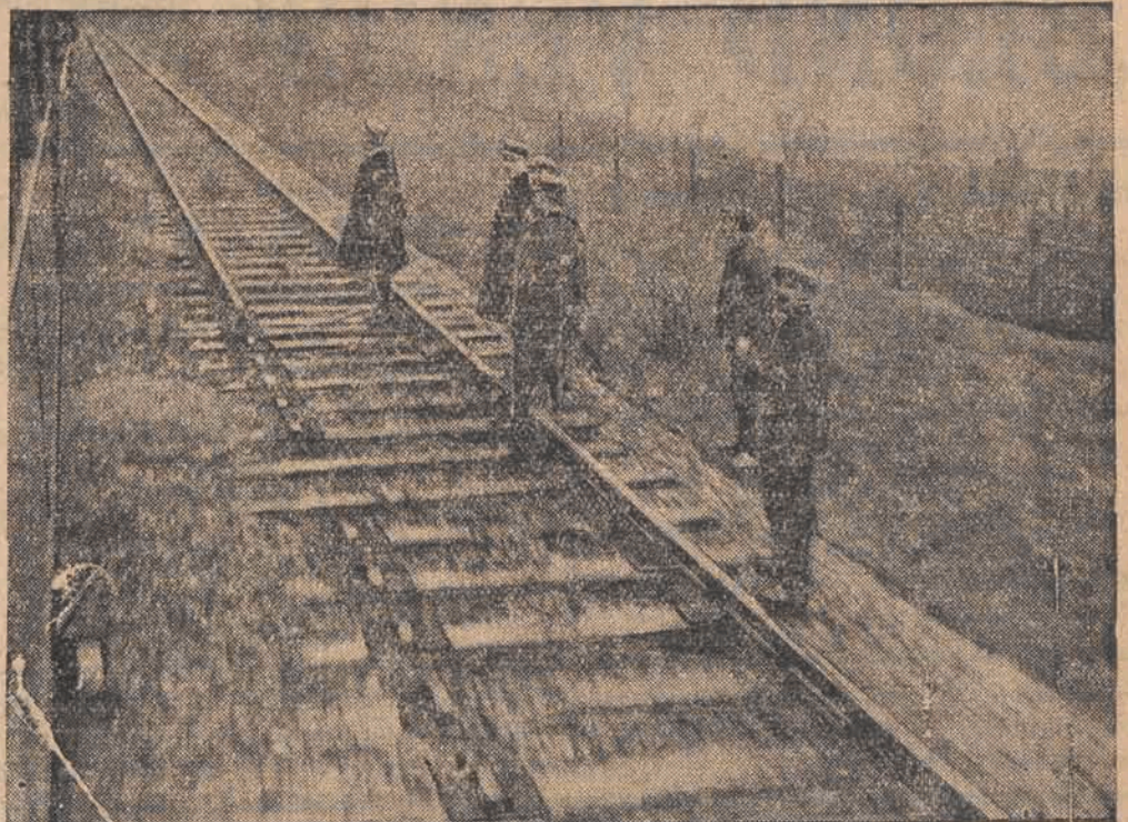
Zniszczony zapomocą dynamitu tor kolejowy kolo stacji Puymagnier, 50 km. przed Nantes. Pociąg, wiozący Herriota został za trzymany i uniknął katastrofy. Zamach był dziełem separatystów bretońskich.