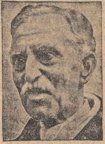
Pułownik Macia, przywódca katalońskich separatystów, którzy na 85 miejsc zdobyli w autonomicznym parlamencie 67.