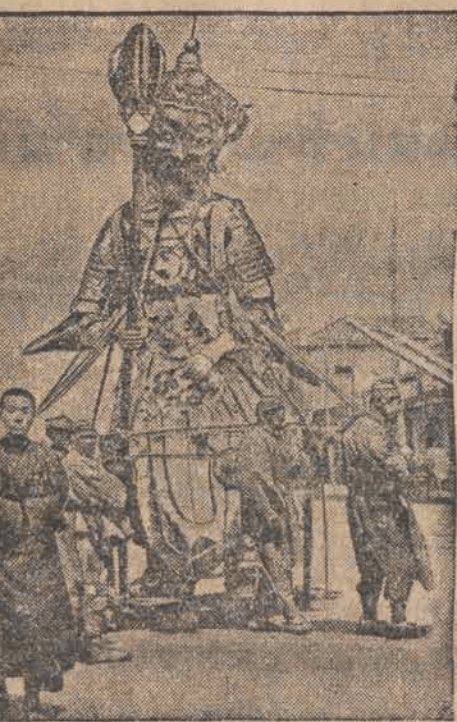
Propagandowy pochód z chińskim bożkiem wojny po ulicach Nankinu, celem zwerbowania ochotników do walki z Japonją.