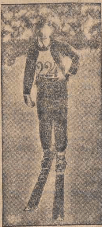
Norweg Birger Ruud najlepszy skoczek narciarski świata, ma zamiar osiedlić się na stałe w Niemczech.