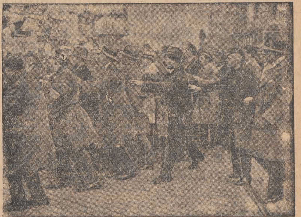
Na ulicach Sofji odbyły się burzliwe demonstracje przeciwko traktatowi w Neuilly, który pozabawił Bułgarię Macedonii.