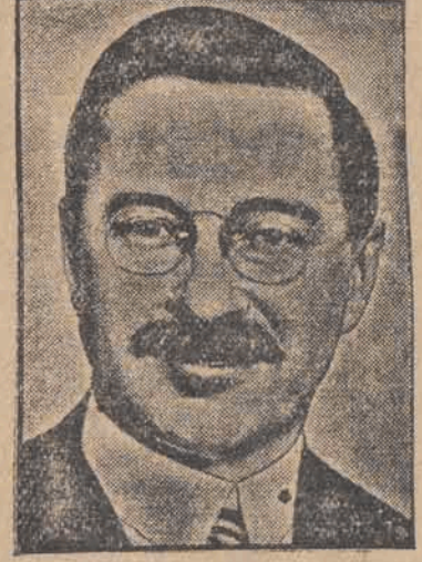
WINTHROP W. ALDRICH, zięć Rockefellera, obejmuje kierownictwo Chase National Banku w Nowym Jorku.