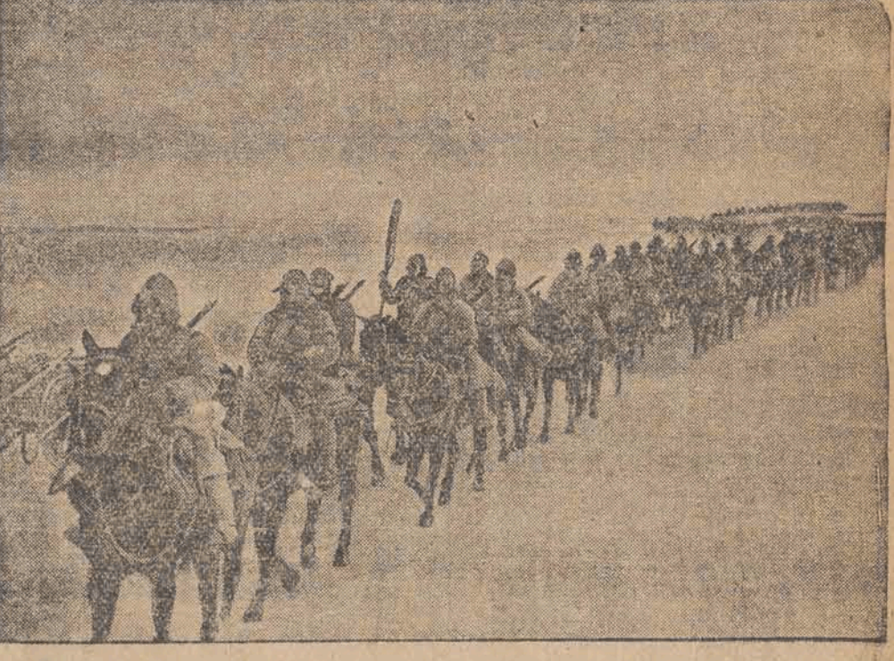
Kawaleria japońska podczas marszu przez śnieżne stopy północnej Mandżurji w pogoni za rozbitymi oddziałami powstańców chińskich.