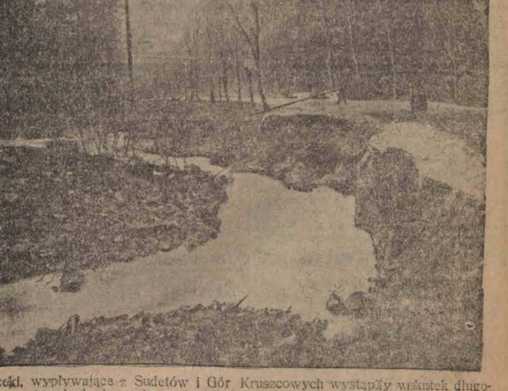
Rzeki, wypływające z Sudetów i Gór Kruszcowych wystąpiły w skutek długotrwałych deszczów z brzegów wyrzuciły obnażając szkody.