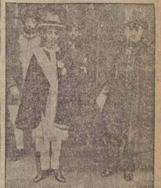
Asfan Wozen, cesarzowiec abisyński przybył w towarzystwie dwóch szwagrow do Paryża, gdzie władze zgłosiły 15-letniemu następcy egzytycznego tronu uroczyste przyjęcie.