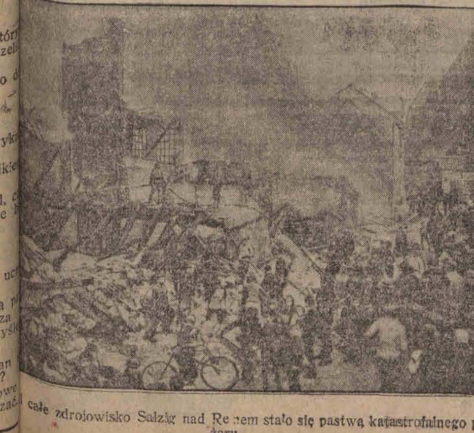
Przezimi pożar w nadreńskim zdrojowisku. Władysław Stypulko, Roman Furmański