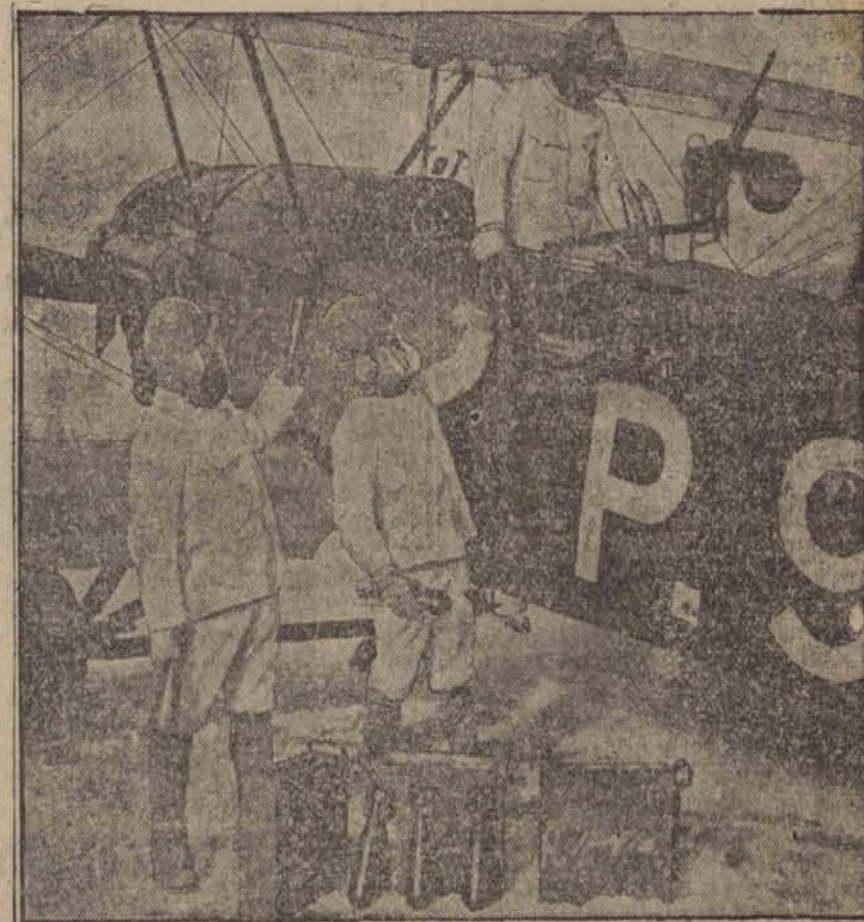
Japoński samolot zabiera ładunek bomb przeznaczonych do bombardowania chińskich miast.