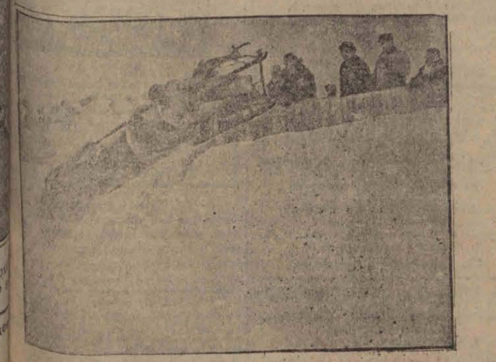
Moment wyrzucenia bobsleig na publiczność. W Antwerpii wybuchł pożar w dużym cyrku Sarrasani, który spłonął doszczętnie. Dwadzieścia trzyosobowych sioni zginęło w płomieniach. Obok dw. Sarrasani.