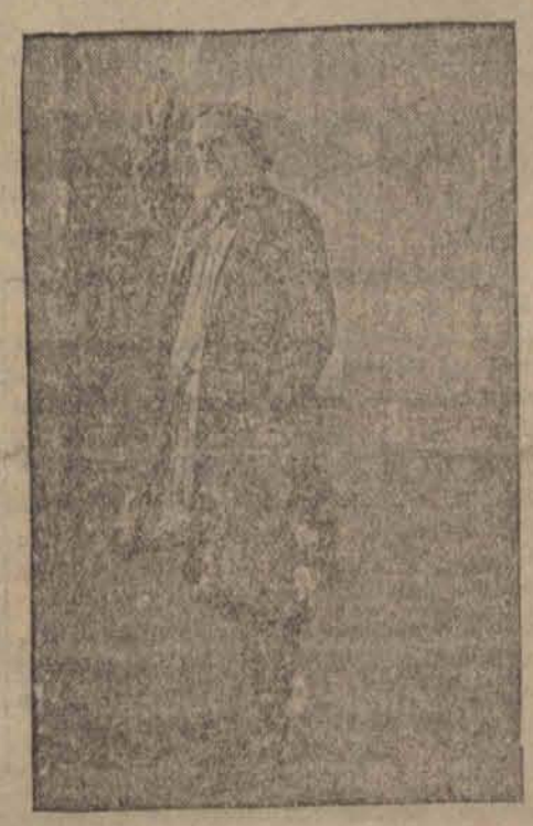
Conrad Veidt w roli Rasputina w wielkim filmie pt. „Śmierć Rasputina”