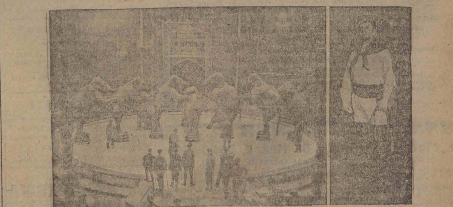
W Antwerpii wybuchł pożar w dużym cyrku Sarrasani, który spłonął doszczętnie. Dwadzieścia trzyosobowych sioni zginęło w płomieniach. Obok dw. Sarrasani.