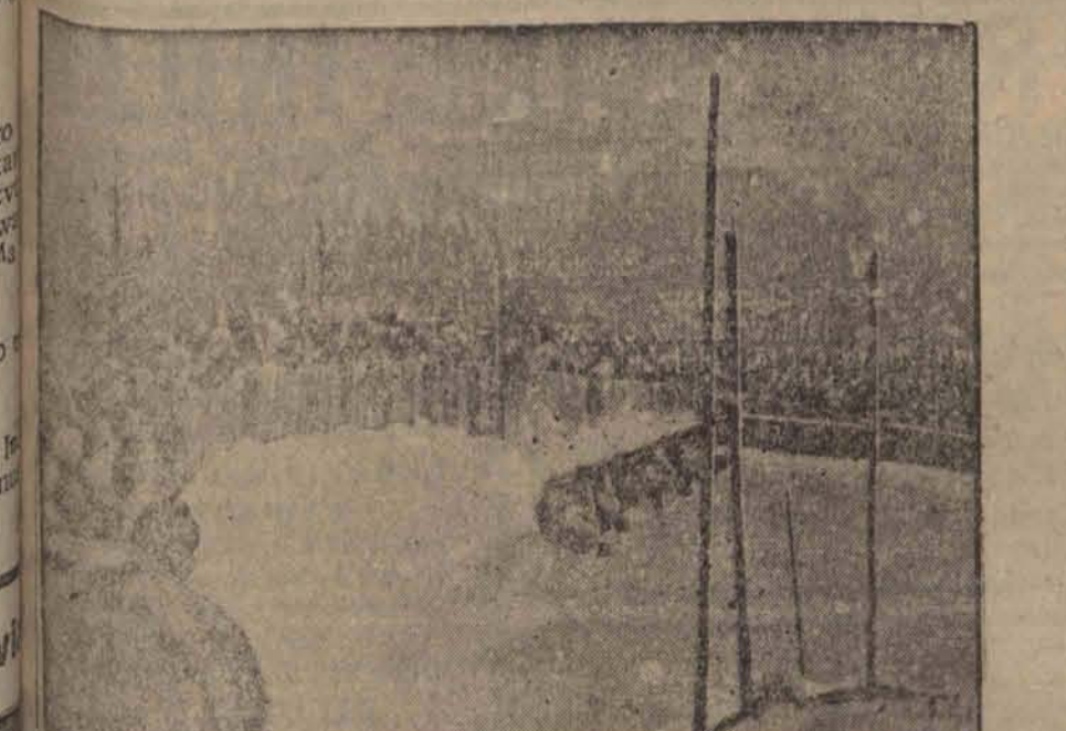
Ułamek sekundy przed katastrofą.