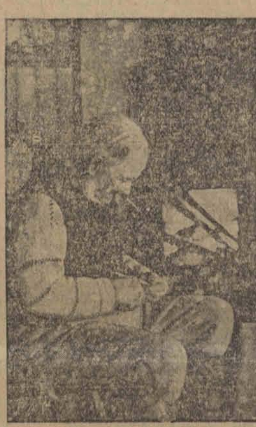
Do najpiękniejszych prowincji Szwecji należy Dalekarkija, kraj wielu prześlicznych legend szwedzkich, oczyszna wielu poetów i literatów oraz artystów-na larzy szwedzkich.