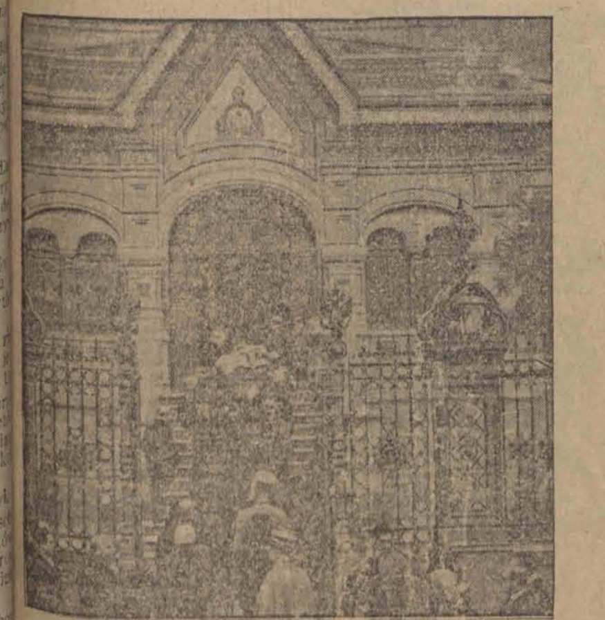
Grzebień królowej greckiej — Zofii (siostry eks-cesarza Wilhelma) złożono do cerkwi prawosławnej w Florencji obok trumny jej męża b. króla Konstantyna.