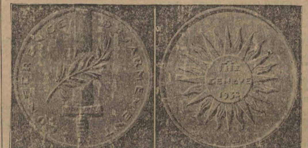
Pamiątkowy medal wybitny ku uczczeniu mającej się odbyć w Genewie konferencji rozbrojeniowej