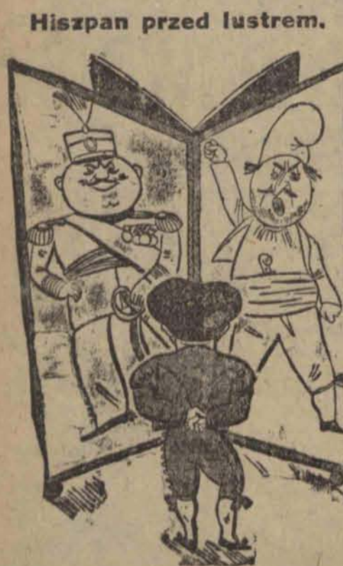
Jaki kostium ubrać?

Wynika z tego jasno, że konferencja zastosowania w strajku tramwajarzy arbitrażu narazie jest zupełnie nieaktualna.