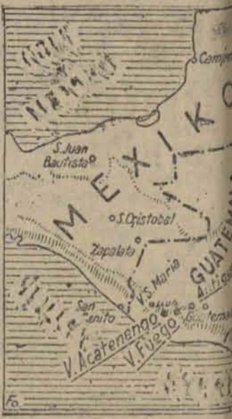
Teren straszliwego wybuchu w środkowej Ameryce