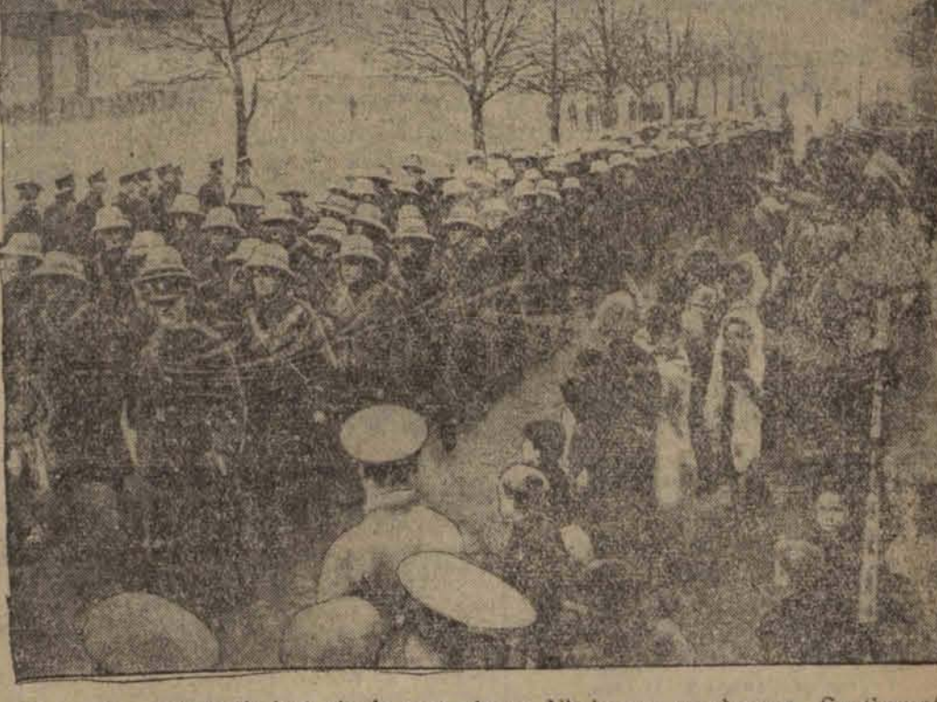
Sytuacja w Indjach jest ciągle naprężona. Niedawno wysłano z Southampton znowu kilka pułków dla usmierzania po wstąpieniu, które wybuchło w północnych Indjach.