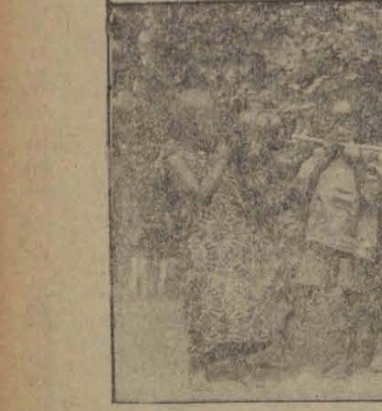
Przedstawienie plim'on murzynskich od najmłodszych lat zdrażana wzajemna niechęć ku sobie.