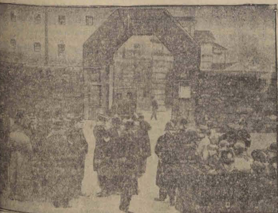
Przed bramą więzienia w Dartmoor po stłumieniu buntu więźniów i ugaszczeniu pożaru.