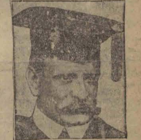
PAWEŁ WERBURG znany bankier nowojorski który stracił w Niemczech kilkadziesiąt milionów dolarów, zmarł przeżywszy 63 lata.