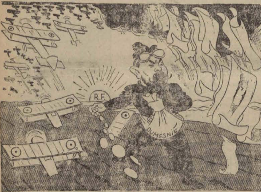
Zbrojenia powietrzne Francji w niemieckiej karikaturze.