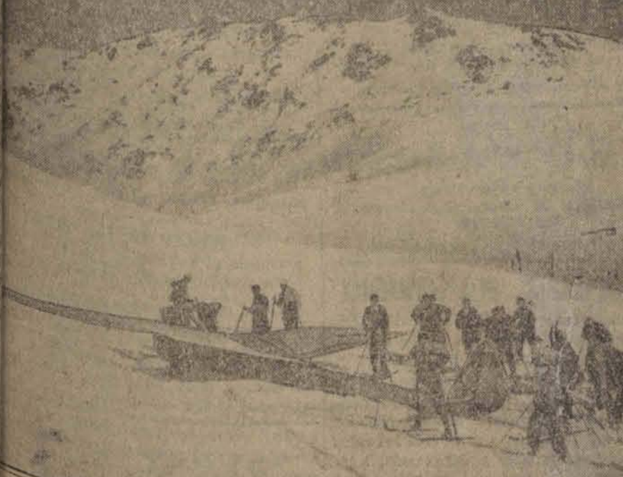
Wędrowni znany as a lotów bezsilnikowych na lodowcu w pobliżu Davos w Szwajcarii po udanym locie przez szczyty górskie.