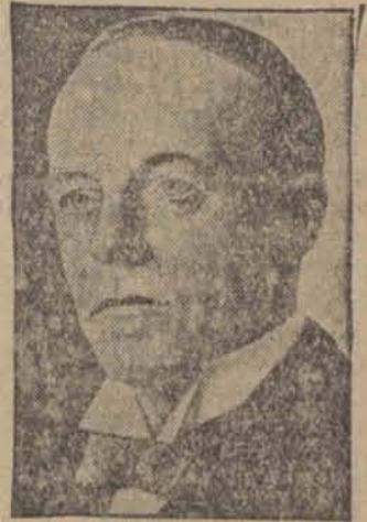
Sir Walter Runciman angielski minister handlu, dał podczas debaty celnej wyraz swej obawie o losy funta, któremu grozi dalszy spadek.