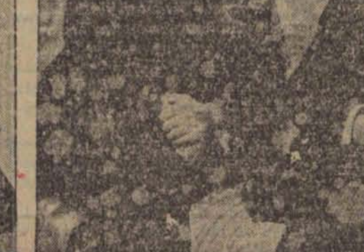
Minister Grandi i przewodniczący konferencji rozbrojeniowej Henderson. wypowiedzieli się przeciwko Francji, a za stronę Niemiec w kwestji równości zbrojeń. Od lewej strony Grandi, 2) Henderson, 3) kanclerz Bruening