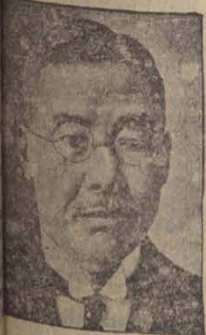
Minister finansów Inosuke, ofiarą zamachu rewolwerowego w Tokio, za potępienie japońskiej wyprawy do Chin.