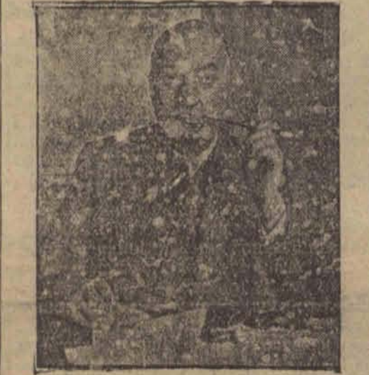
Edgar Wallace jeden z najbardziej poczytnych autorów powieści sensacyjnych zmarł na zapalenie płuc w Hollywood, gdzie filmowano jedną z jego sztuk.