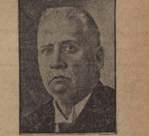
Teeman (partja agrarna) został premierem i zarazem naczelnikiem państwa estońskiego.