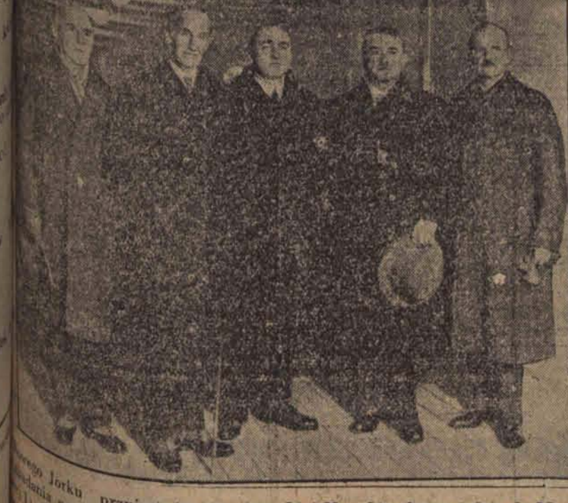
Władziska komisja w drodze do Azji.