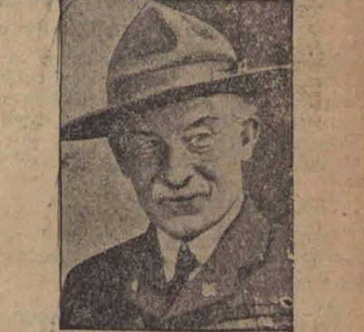
General Robert Baden - Powell twórca harcerstwa, kończy dnia 22 marca 75 lat życia. General Powell przybędzie latem do Polski.