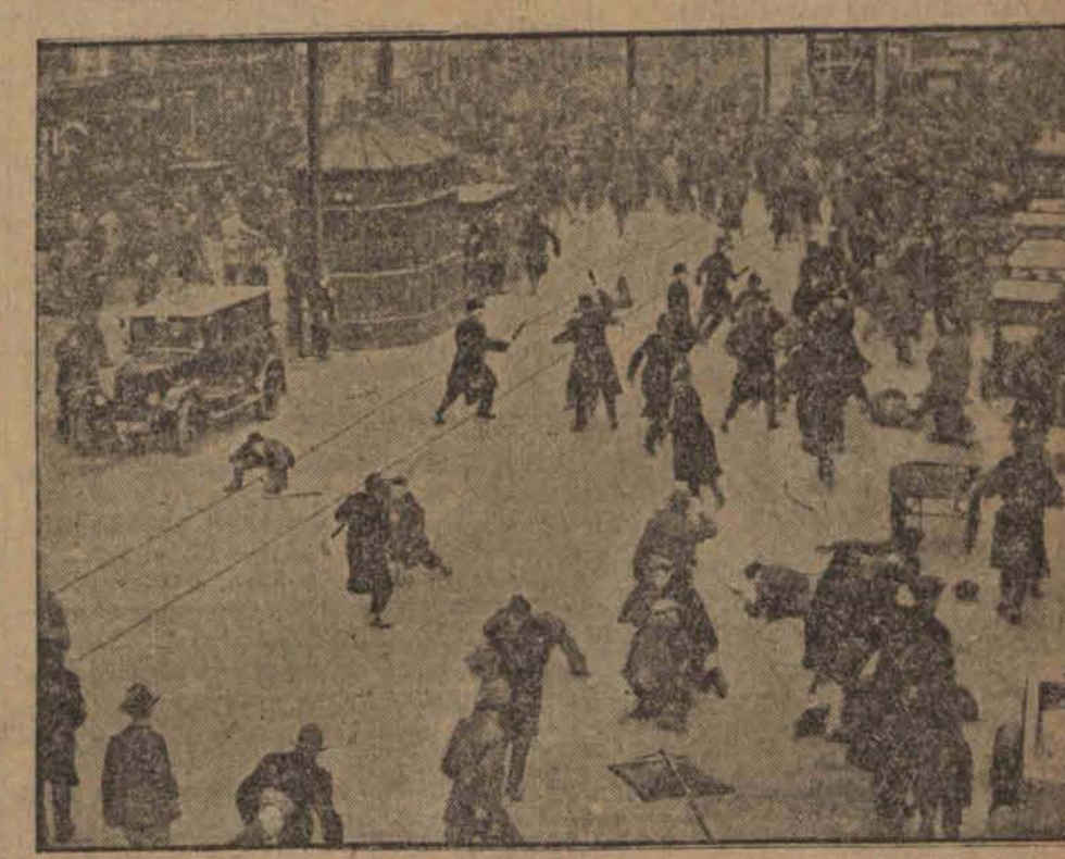
Demonstracje komunistyczne w Londynie doprowadziły do ostrych starć z policją.