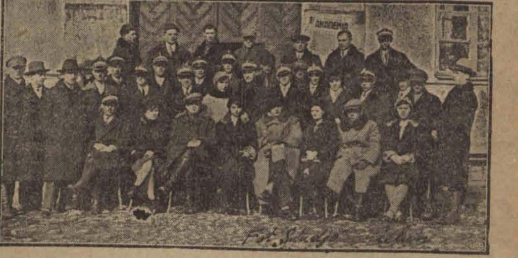
3 dniowy kurs społeczno-oświatowy dla działaczy Zw. Młod. Lud. pow. Wieluńskiego odbyty w Wieluniu 10, 11, 12 marca r. b.