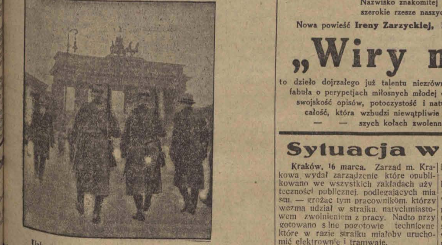
Uzbrojone patrole policji na ulicach Berlina.