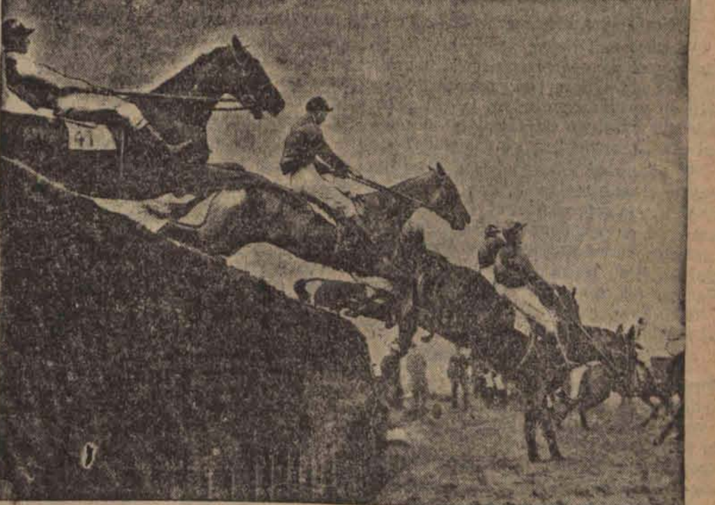
Wysoki wał „Beechers Brook“ na torze w Liverpoolu, gdzie corocznie 18 marca odbywa się najtrudniejszy bieg świata.