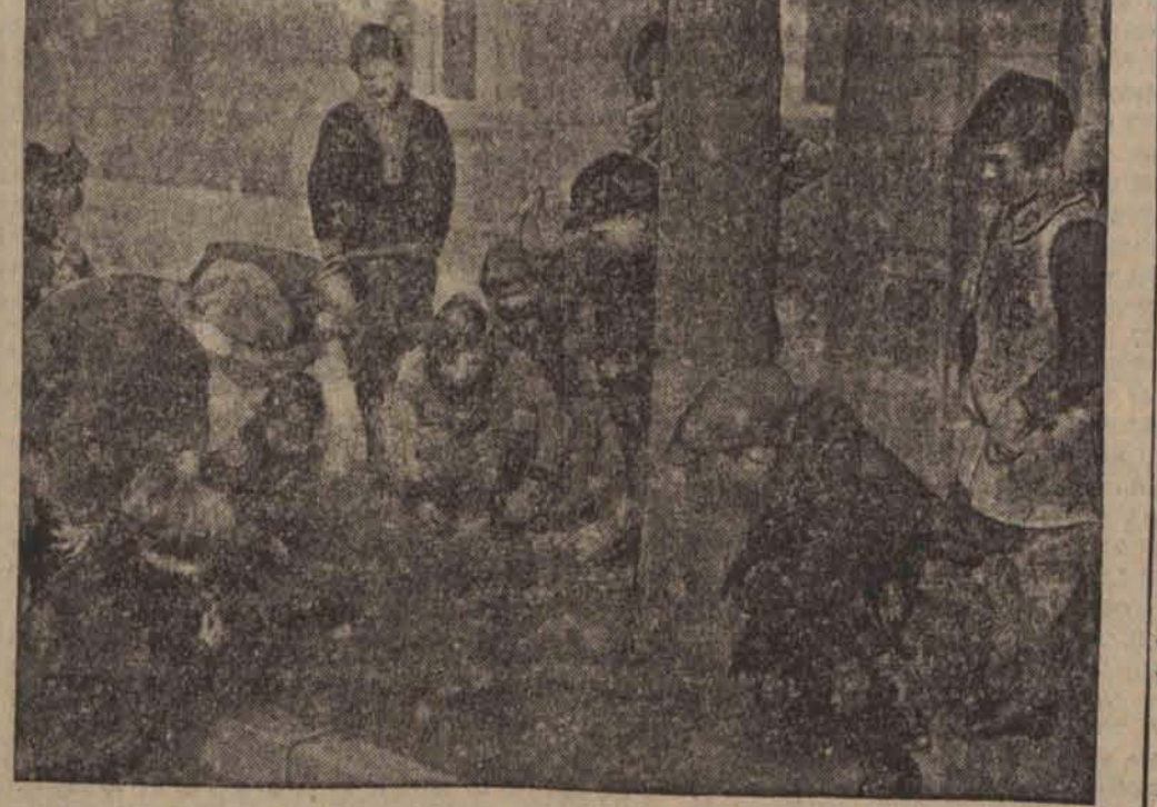
Pierwsze promienie słońca wywabiają na wilgotny i zimny jeszcze chodnik młodzież oddającą się z całym zapalem rozmaitym grom.