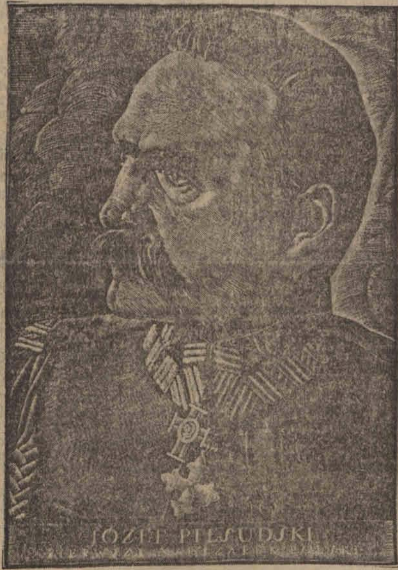
składa hołd Dostojnemu Solenizantowi.