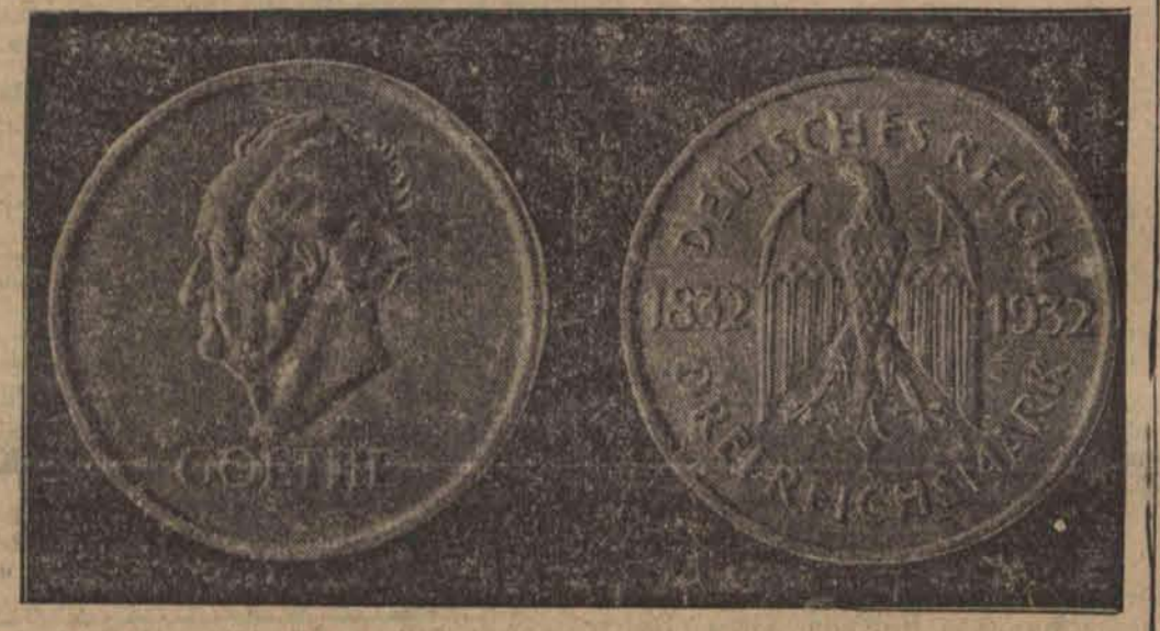
Rzesza niemiecka wybiła nową monetę srebrną trzymarkową ku uczczeniu stulecia zgonu Goethego.