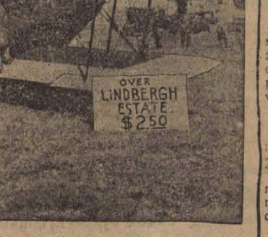
Wzrost nawet na cudzem nieszczeniściu robią interesy. Taksówka samolotu... owozu oczekiwać za opłatą 2: pół dolara nad domem Lindberghów... ślad porwano dziecko sławnego lotnika