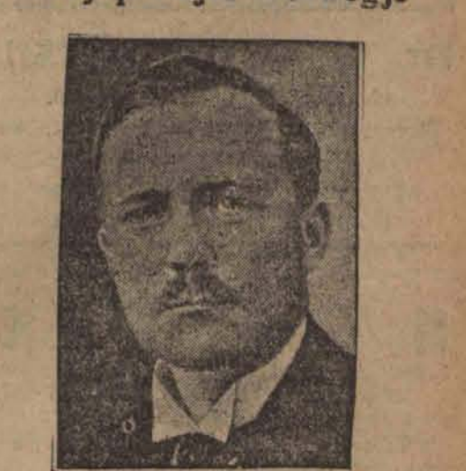
Jens Hundseid przywódca norweskich agraryjuszów został mianowany następcą zmarłego premiera Kolstadta.