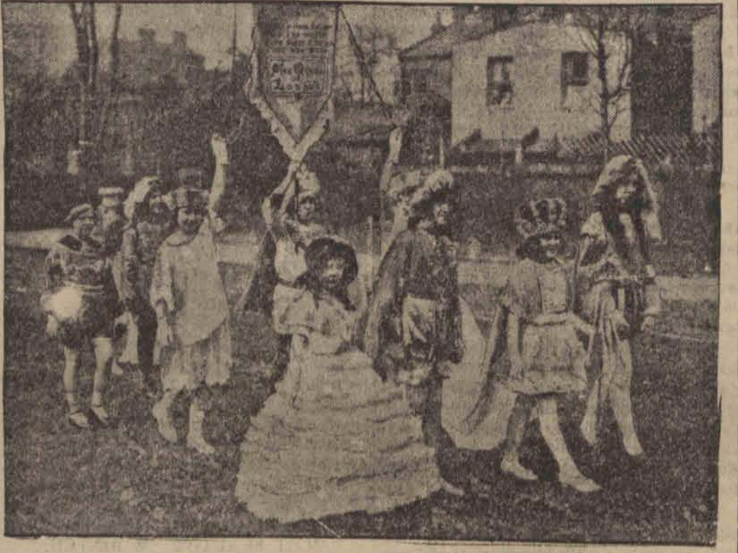
Londyn z nastaniem wiosny wybiera corocznie małą dziewczynkę królową wiosny. Młodociana królowa wśród orszaku dworskiego udaje się po nagrodę.