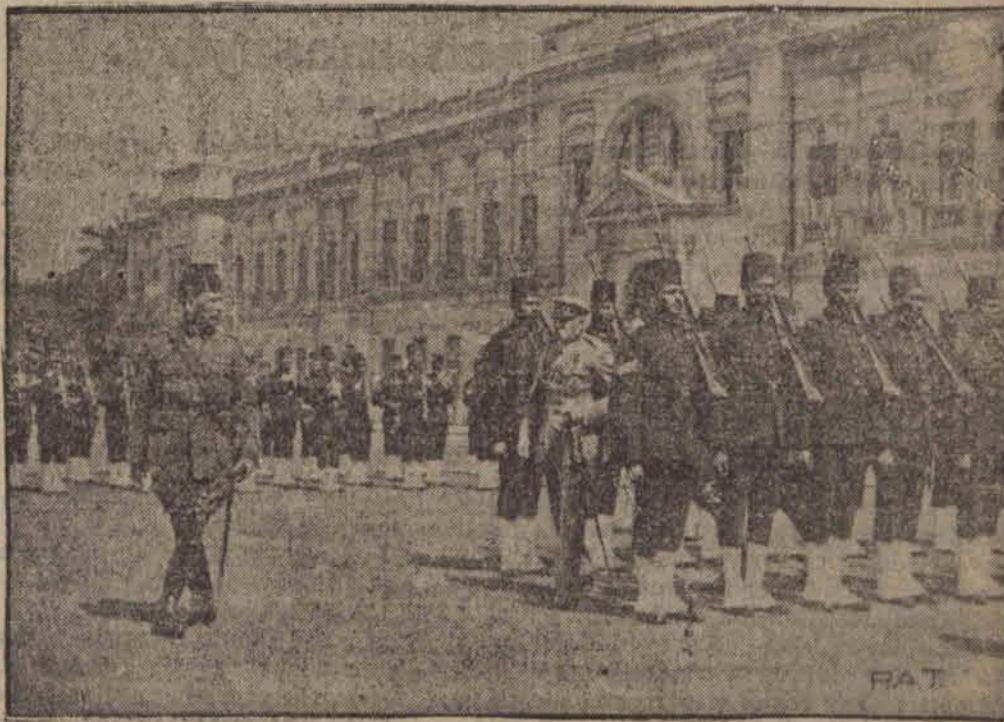
Fragment z przyjęcia Pana Marszałka przez króla Egiptu Fuada Igo. Przed zamkiem królewskim Abdine w Kairze ustatyła się kompania honorowa gwardji królewskiej. Marszałek Piłsudski przechodzi przed frontem kompanji honorowej.