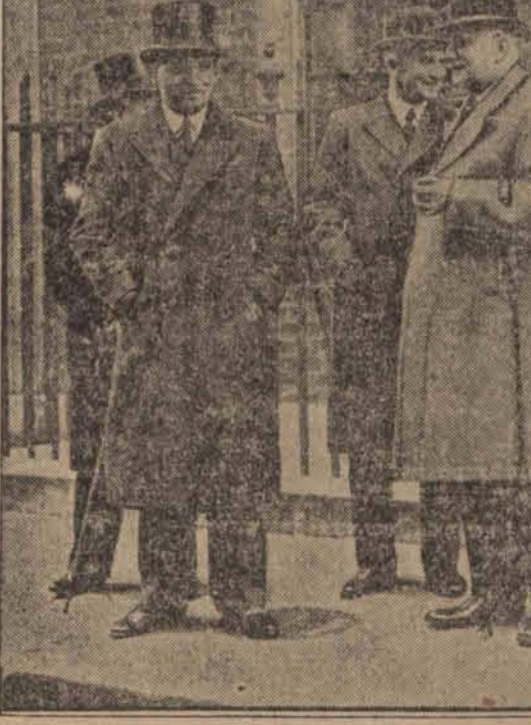
Delegacj mocarstw na zakończoną niepowodzeniem konferencję londyńską przed gmachem ministerstwa spraw zagranicznych. Od lewej strony ku prawej: 1) Grandi (Włochy), 2) Sir John Simon (Anglja), 3) Neurath (Niemcy).