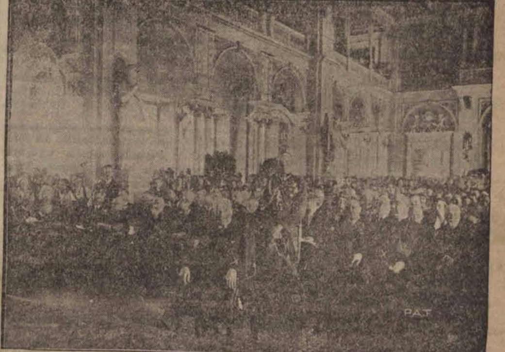
W Sali Rady Miejskiej odbyła się wielka akademja z okazji 25-lecia Polskiego Towarzystwa Krajoznawczego. Na akademji byli obecni: Pan Prezydent Rzplitej kardynał Kakowski oraz przedstawiciele Rządu.