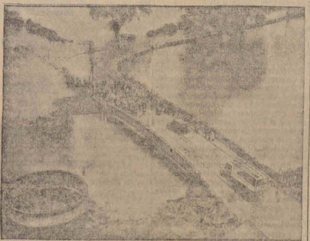
Długotrwała nawa w Anglii spowodowała katastrofalną powódź, którą w całym kraju wyrządziła olbrzymie szkody. Jest to najwęższa powódź od lat 30. Na zdjęciu: zalana szosa pod Rugby.