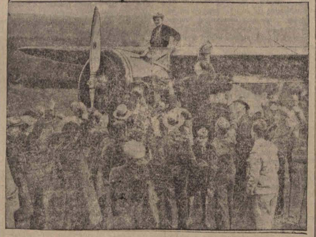
Owacje okolicznej ludności po wylądowaniu Miss Amelji Earhart w pobliżu Londonderry na cześć śmiałej pogromczyni Atlantyku