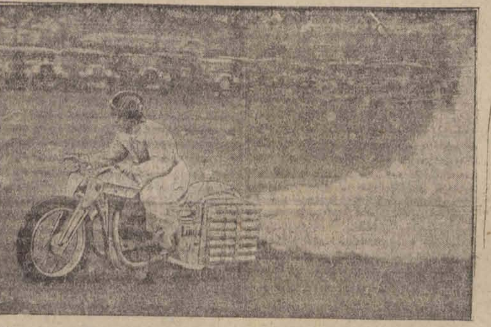
Inżynier Lührs demonstruje raketowy motocykl wyciągowy.