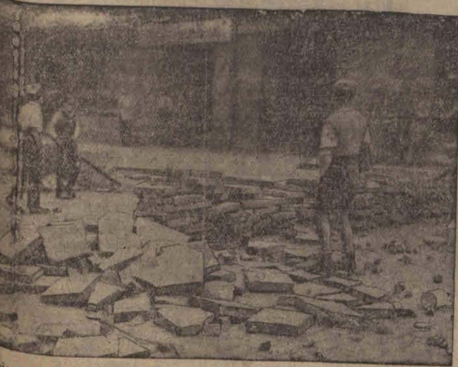
Wojennej dzielnicy Berlina Moabit komunisty w czasie starć z policją wzniesli w kilku miejscach barykady z kamieni i płyt brukowych.