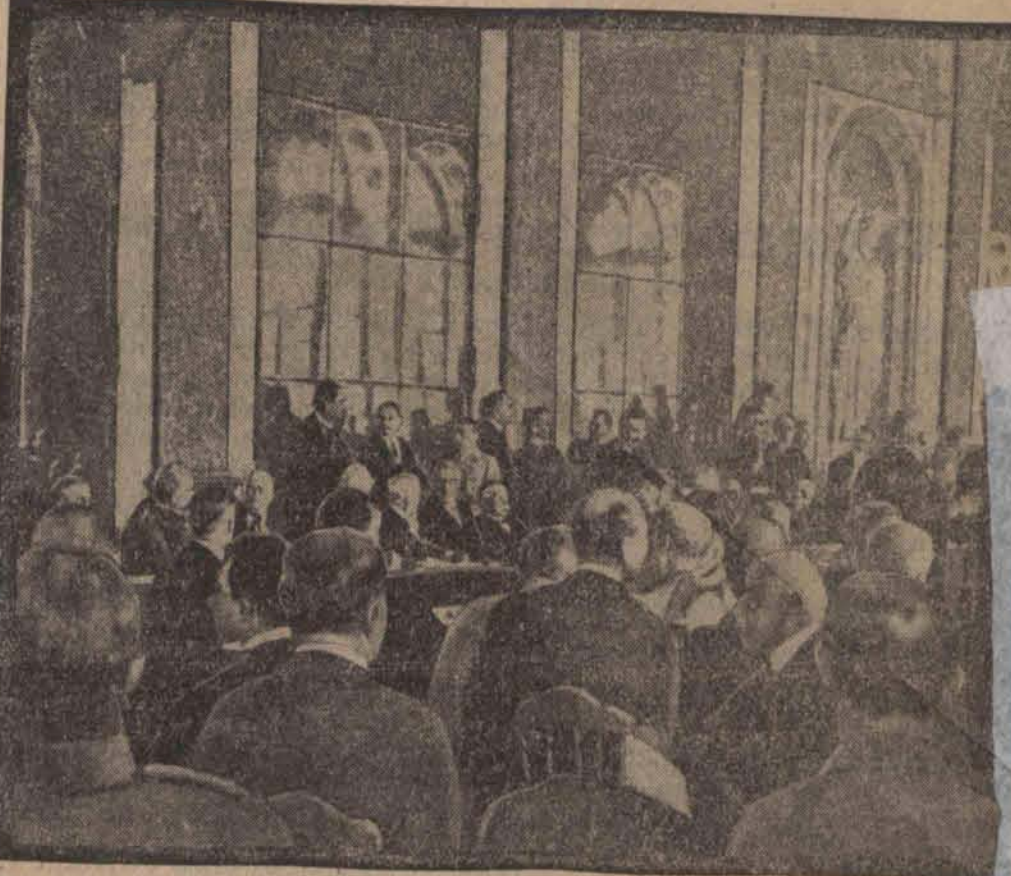
Akt podpisania paktu pokoju w Wersalu w dniu 28 czerwca 1919 roku. Pośrodku z prawej strony stoją odwrócenie Clemenceau i Wilson.