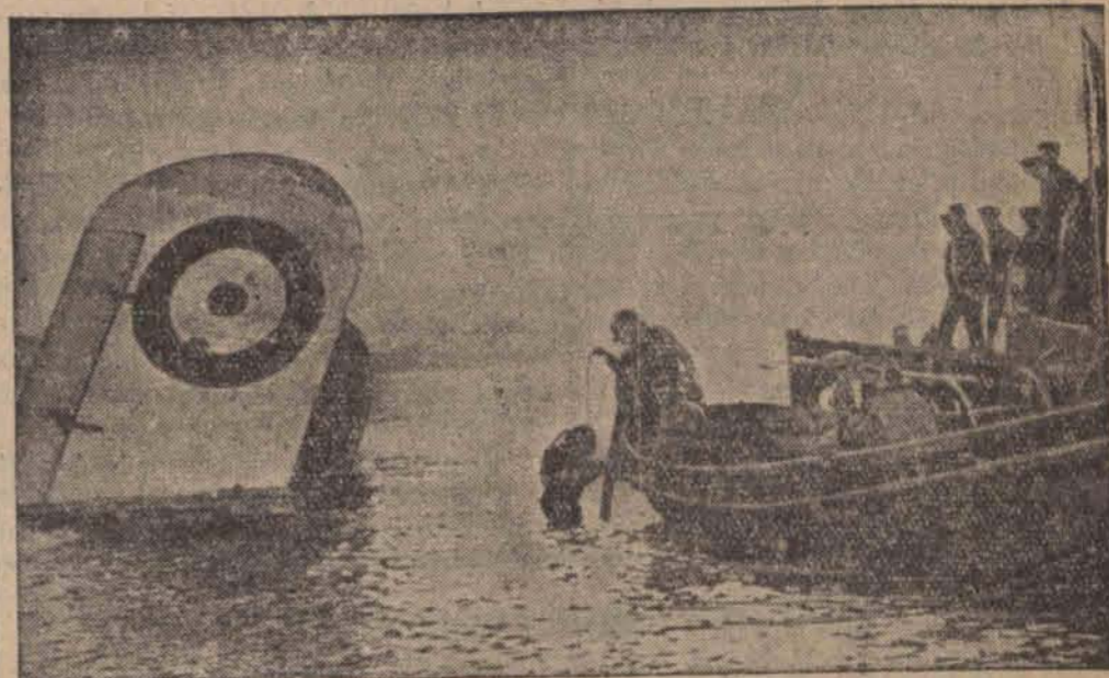
Wystające z wody skrzydło olbrzymiego hydroplanu, który uległ katastrofie w porcie Plymouth, zderzwszy się podczas startu z motorówką. Na ilustracji widzimy opuszczanie się nurka dla założenia lin dookoła kadłuba statku.