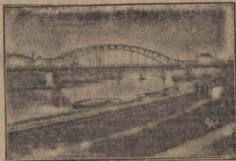
W dniu 19 b. m. odbędzie się w Krakowie uroczyste otwarcie nowego mostu na Wiśle. Most ten, leżący w przedłużeniu ulicy Krakowskiej, stanowi najdogodniejsze i najbliższe połączenie starego Krakowa z dawnym Podgórzem. Projektowany jeszcze przed wojną, most ten wchodzi w stadium realizacji dopiero w sierpniu roku 1925. Koszt budowy tego mostu wynosi w całości około 5 milionów złotych. Most jest konstrukcją żelaznej, trójprzęsłowej, o belazym łuku dwuprzęsłowym.