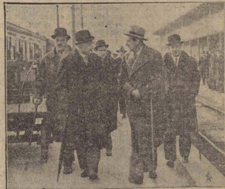
Minister Spraw Zagranicznych p. Beck wrócił do Warszawy. Na dworcu witali go ministrowie i ambasador Skirmunt.