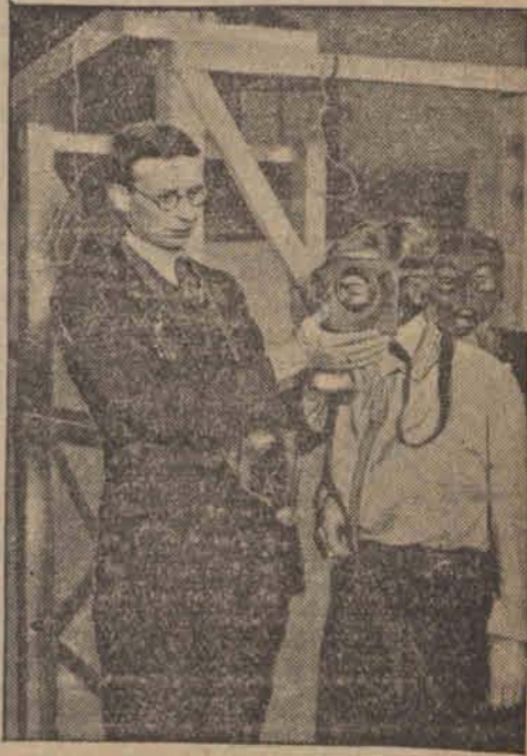
W szkołach saskich wprowadzono przymusową naukę o obronie przeciwgazowej.