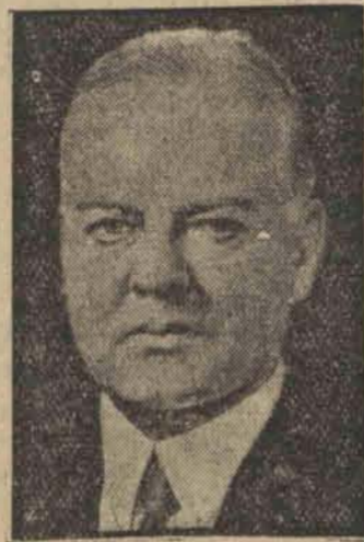
Ustępujący prezydent Herbert Hoover