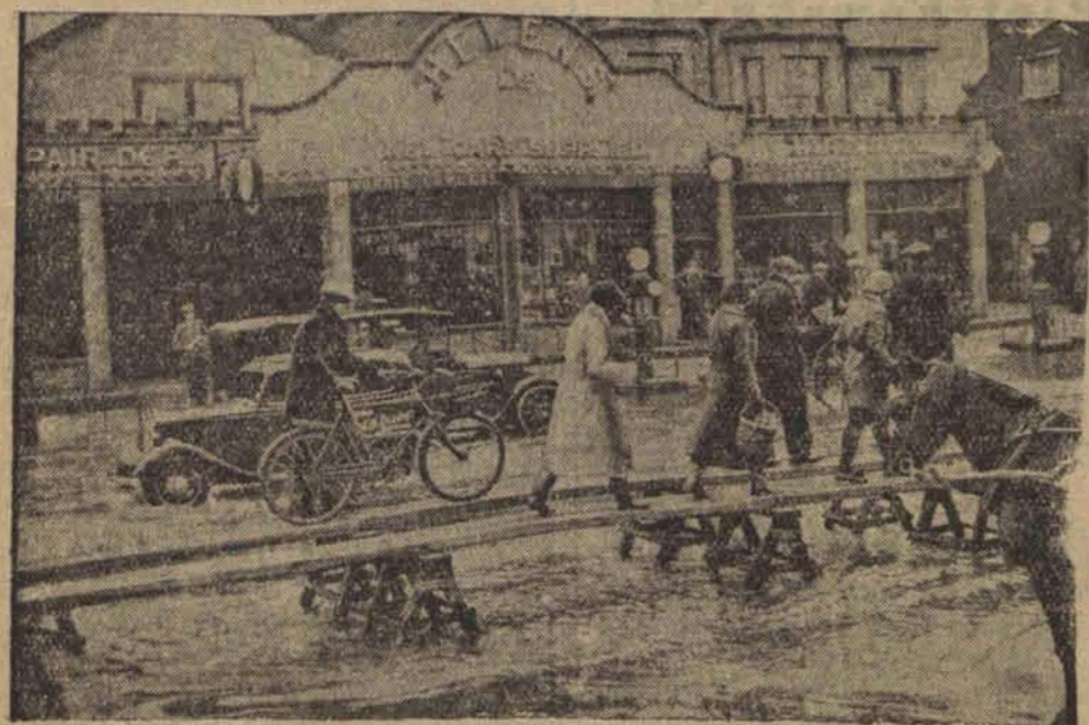
Wszystkie miasta południowej Anglii zostają nawiedzane klęską powodzi. Dla ułatwienia ruchu pieszego zarządy miast ułożyły specjalne chodniki z desek na kołach.