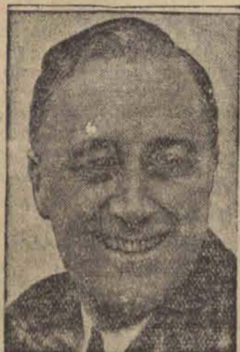
Nowy prezydent Franklin D. Roosevelt