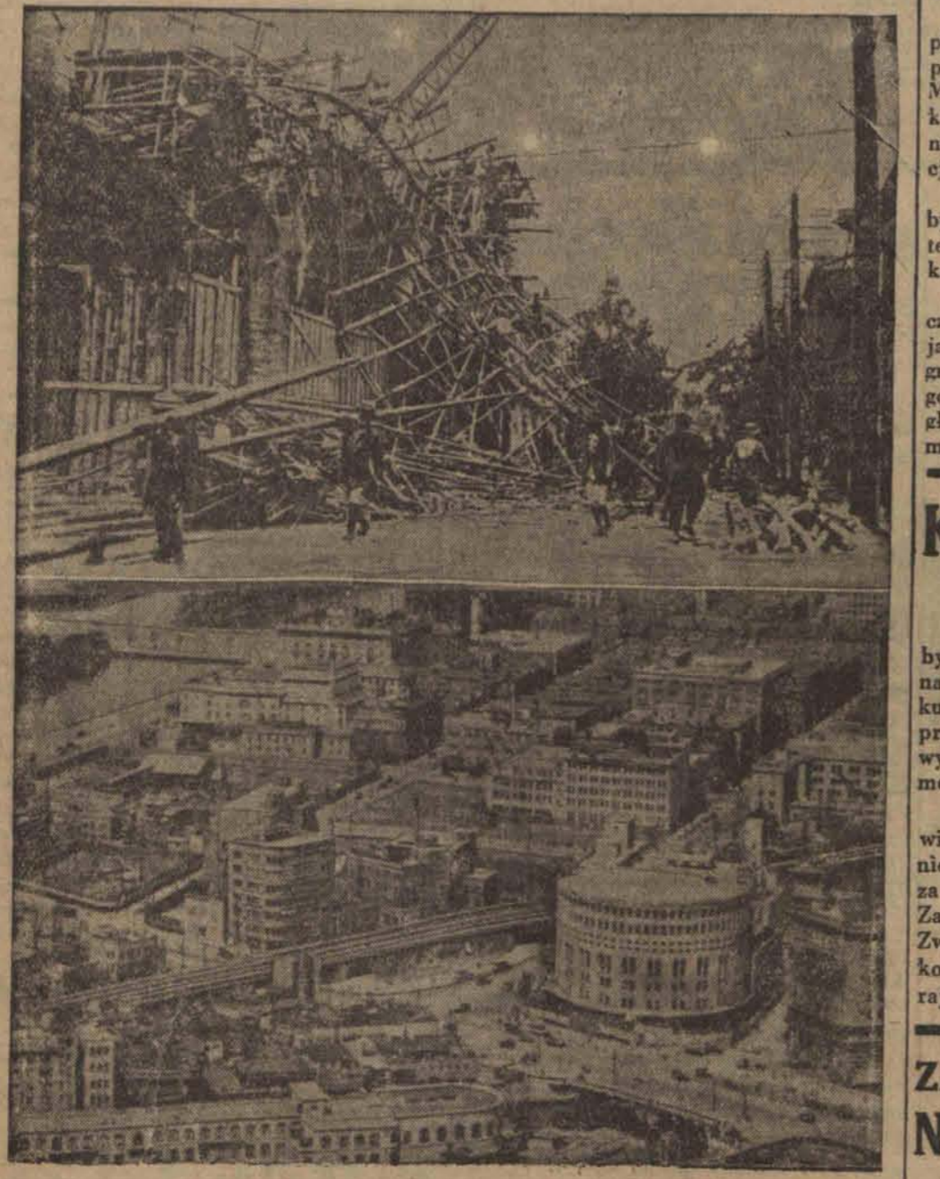
Japonję nawiedziło znowu straszliwe trzęsienie ziemi. U góry: Zniszczone miasto portowe. U dołu: Centrum Tokja, zbudowane na elastycznych palach, które zabezpieczają je od wstrząsów podziemnych.