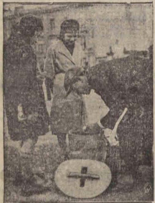
Uliczny sprzedawca lodów, cieszący się wielką popularnością wśród dziatwy podmiejskiej.