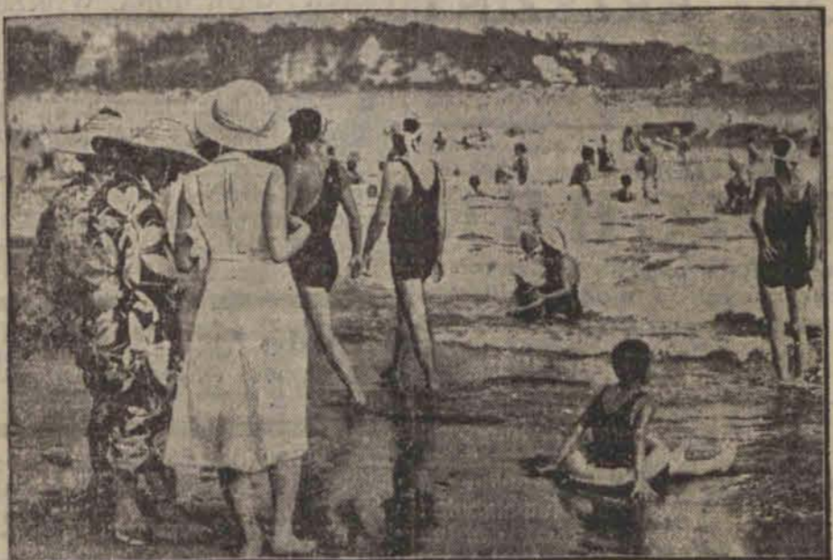
Gdyby nie kimona na pierwszym planie, nikt nie odgadłby, że to plaża w pobliżu stolicy Japonii.