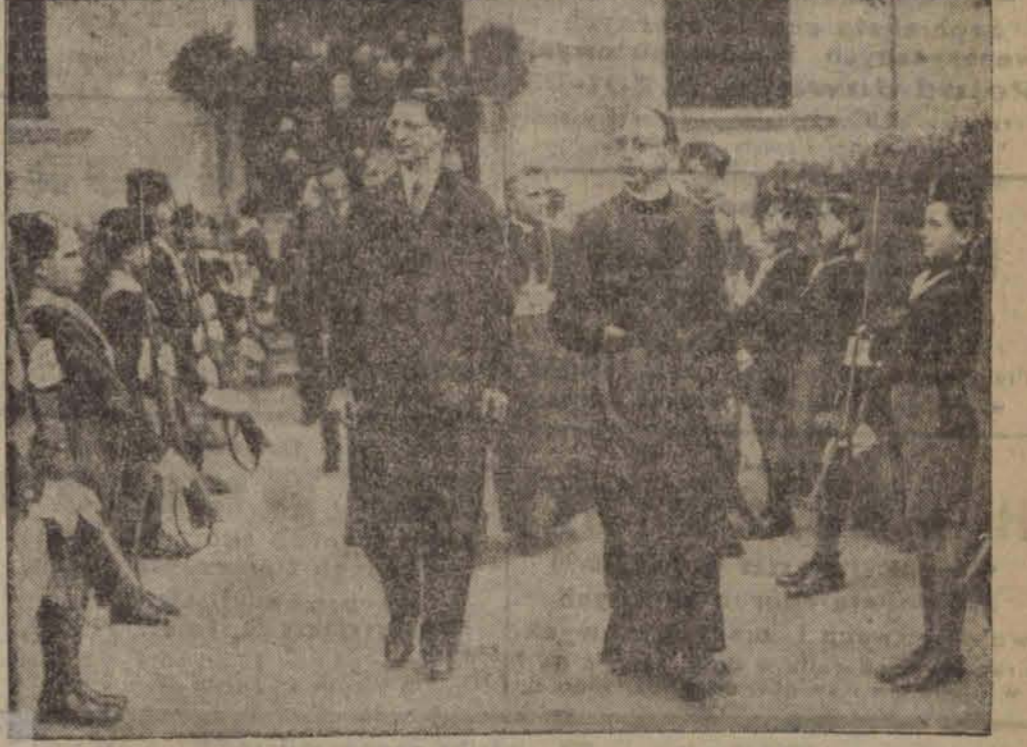
De Valera, prezydent Irlandji, zwiedza szkołę przysposobienia wojskowego, gdzie młodzież prezentuje przed nim broń.