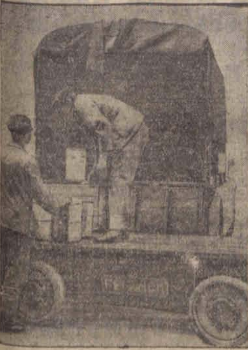
Transport złota francuskiego wysyłany do Anglii na pokrycie długów.