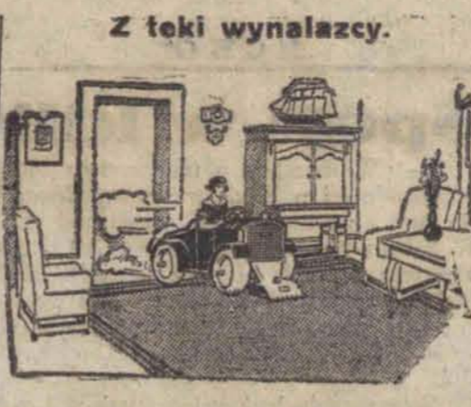
Z teki wynalazcy. czyli polerowanie posadzki zapomocą samochodzika lilliput

Ulubionym trykiem złodziejek jest małe dziecko, występujące jako przymusowy pomocnik. Złodziejka, odgrywająca rolę matki, szczypli dziecko, które zaczyna płakać. Potem kłęką, aby uspokoić płacz dziecka i osuszyć mu łzy, co zabiera więcej czasu. W tej pozycji może z łatwością kraść torebki przechodzących właśnie przez magazyn kupujących kobiet.