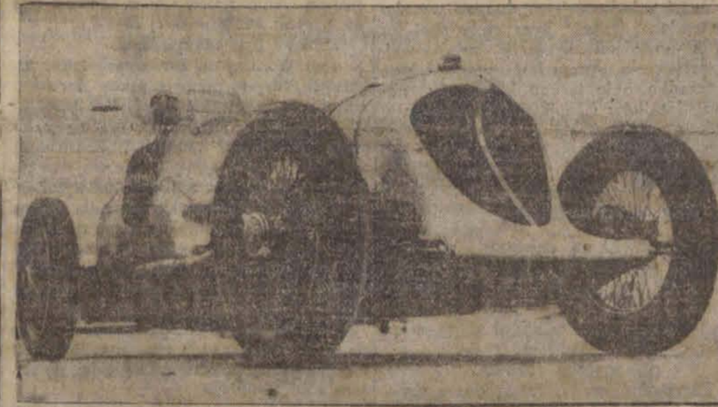
Amerikanin Cobb zamierza na swej maszynie przebyć 2.500 mil angielskich w ciągu 24 godzin.