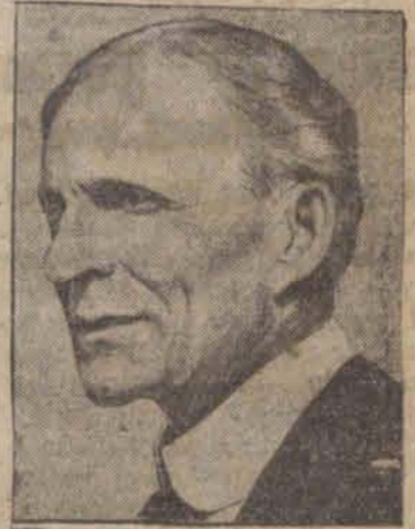
Henryk Ford, król automobilowy, obchodzi 30 b. m. 70-lecie swych urodzin.