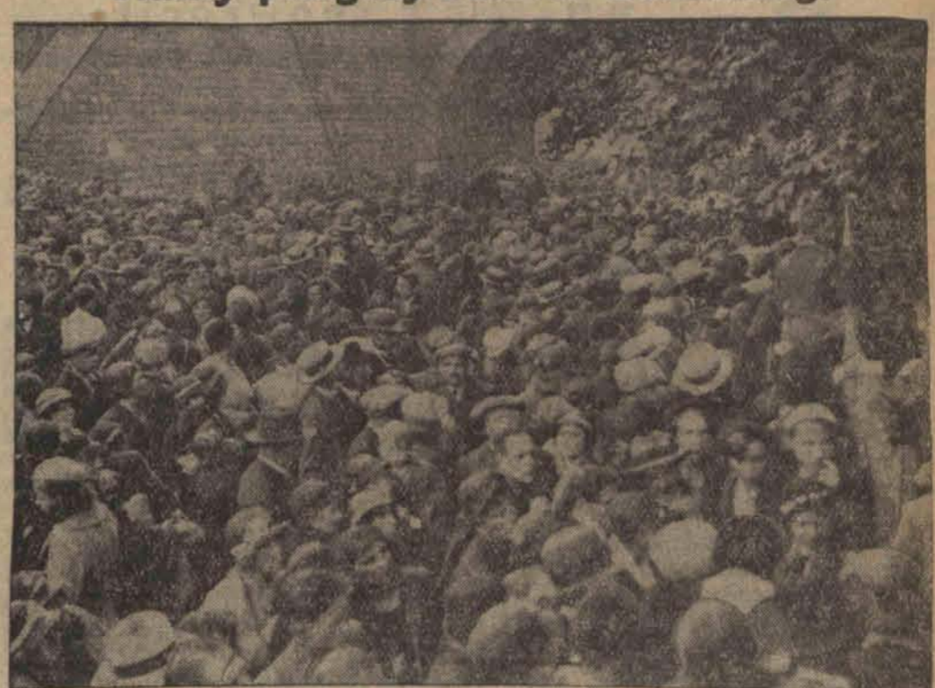
Jak już donieśliśmy zgromadziło się ubiegłej niedzieli w małej wiosce belgijskiej Beauraing 150.000 pielgrzymów ze wszystkich stron, aby ujrzeć miejsce gdzie pojawił się miała Matka Boska 5 dzieciom i jednemu robotnikowi. Na ilustracji tłumy w pobliżu stacji Beauraing.