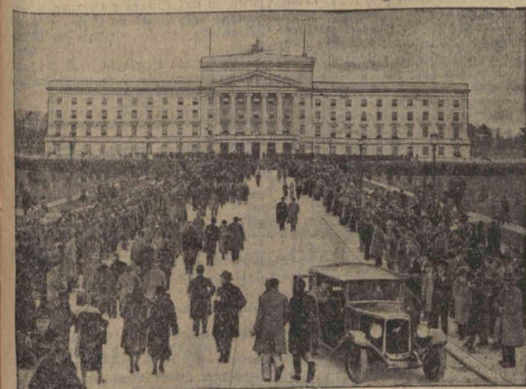
Irlandzcy faszyci w niebieskich koszulach proklamowali przewrót. Celem ochrony gmachu parlamentu (na zdjęciu) obsadzono go 300 wybranymi przez premiera de Valerę wyborowymi strzelcami. Mimo to sytuacja jest nadzwyczajną na przęzna.