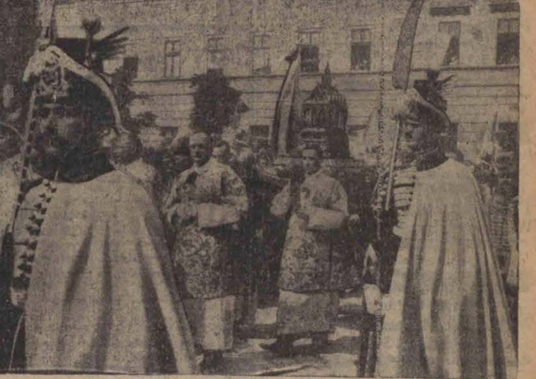
Wspaniała procesja z relikwiami św. Stefana, króla i apostoła Węgier w otoczeniu gwardji na ulicach Budapesztu.