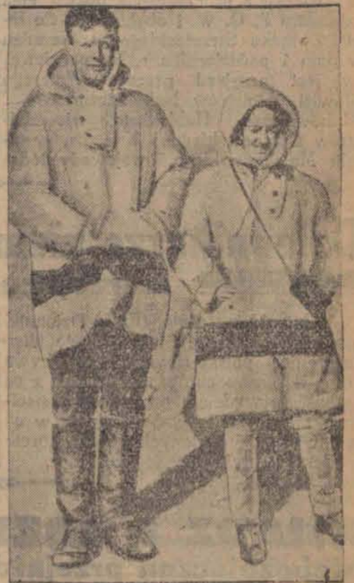
Słynny lotnik Lindbergh i jego żona wylądowali na lotnisku w Moskwie.