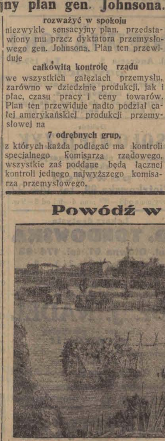
Zalane przedmieście Zagrzebia, Jugoslawie nawiedzita powódź, jakiej od stu lat nie pamiętają.