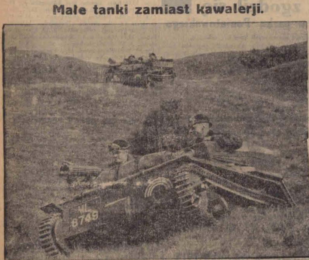
Podczas manewrów w Salisbury Plain w Południowej Anglii zastosowano po raz pierwszy małe szybkie tanki w ilości 3.000 sztuk, które zastąpiły w zupełności kawalerję, na najbardziej nierównym terenie.