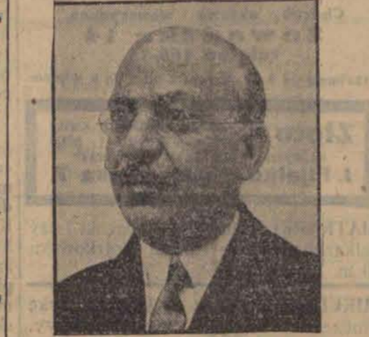
Abd el Yehia Pasza prezydent egipskiego senatu otrzymał misję utworzenia nowego gabinetu.