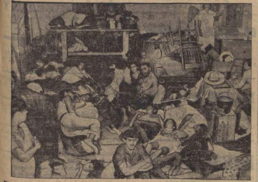
W niedźnych barakach pomieszczono resztki mienia i ocalałych z żywiołowej katastrofy mieszkańców miasta Tampico w Meksyku.