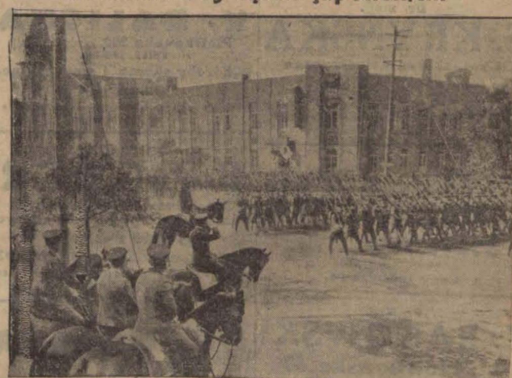
Defilada japońskiej armii okupacyjnej w Mandżurji w drugą rocznicę okupowania tego kraju przez wojska mikada.