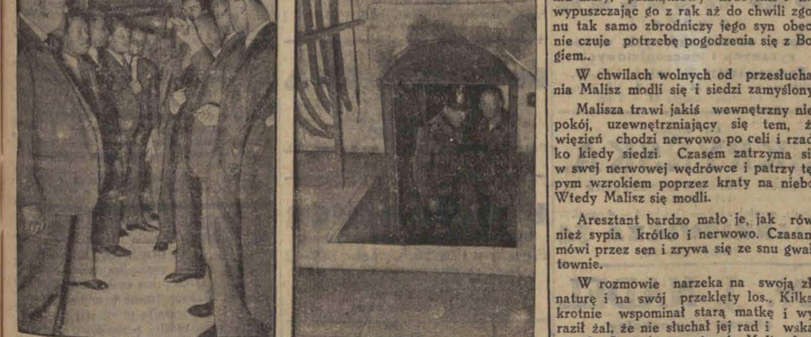
Dwukrotnie sąd Rzeszy odbywał wizję lokalną w podziemiach Reichstagu, badając przedewszystkiem przejście między mieszkaniem premiera Goeringa a właściciwym Reichstagem. Po prawej stronie: Wejście do tunelu łączącego Reichstag z pałacem premiera. Po lewej stronie: Dziennikarze w tunelu przysłuchują się objaśnieniom świadków.