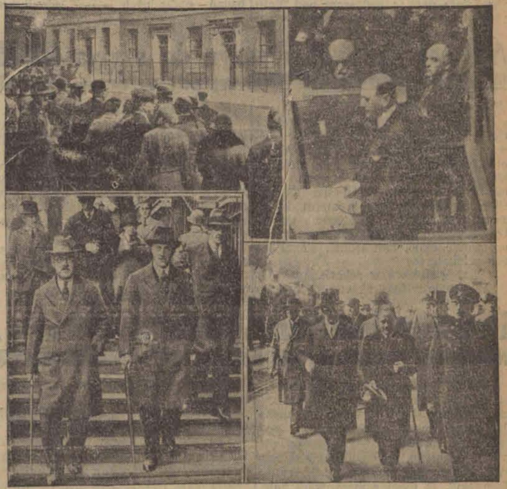
U góry po lewej stronie: Publiczność czeka przed siedzibą angielskiego premiera Downing Street 10, na wyniki na rad gabinetu. Po prawej: Premier francuski Daladier mówi w Izbie o zagadnieniach budżetowych i rozbrojeniowych. U dołu: 1) Mac Donald i angielski minister spraw zagranicznych opuszczają prezydium rady ministrów; 2) Minister spraw zagranicznych Czechosłowacji Benes opuszcza w towarzystwie kanclerza Dollfusa dworzec kolejowy w Wiedniu.