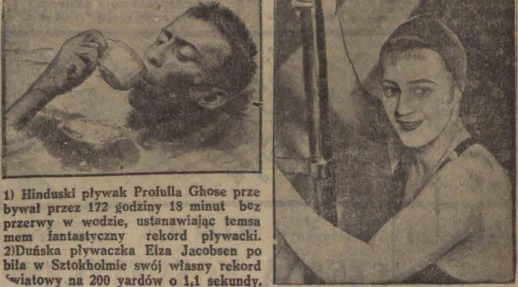
1) Hinduski pływak Profulla Ghose przebywał przez 172 godziny 18 minut bez przerwy w wodzie, ustanawiając temsamem fantastyczny rekord pływacki. 2) Duńska pływaczka Elza Jacobsen po biła w Sztokholmie swój własny rekord światowy na 200 jardów o 1,1 sekundy.