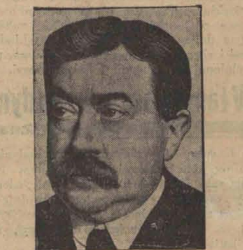
Wielokrotny premier i minister francuski, znakomity uczyony Paweł Painlevé zmarł wczoraj w Paryżu na chorobę serca.