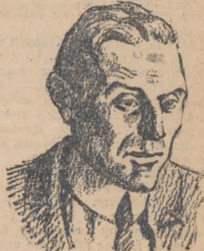
Cecil Hurst, angielski prawnik, został mianowany prezesem Międzynarodowe- go Trybunału Sprawiedliwości w Hadze