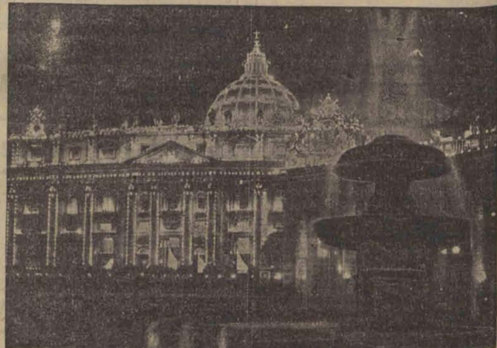
Z okazji nadchodzących Świąt Bożego Narodzenia watykańska elektrownia urządziła próbna iluminację bazyliki św. Piotra, która wypadła imponująco.