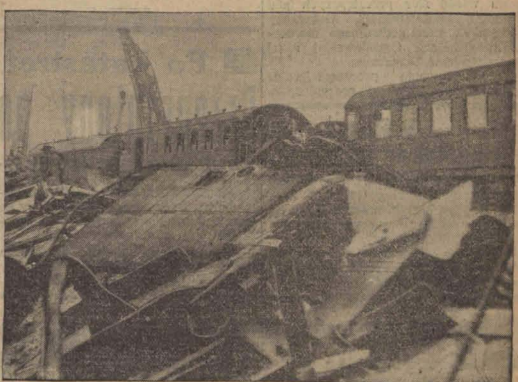
Spiętrzone wagony strzaskanego pociągu w Lagny, gdzie zgórą 200 osób utraciło życie, a 500 odniosło rany.