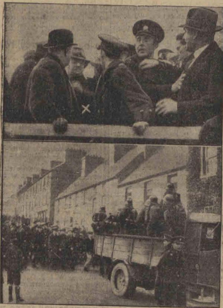
Ponowne aresztowanie generała O'Duffy wywołało olbrzymie wrażenie w całej Irlandji. U góry: Aresztowanie przywódcy faszystów irlandzkich generała O'Duffy, (x). U dołu: Policja odprowadza generała podczas gdy wojsko czeka w pogotowiu aby stłumić ewentualne odruchy jego zwolenników.