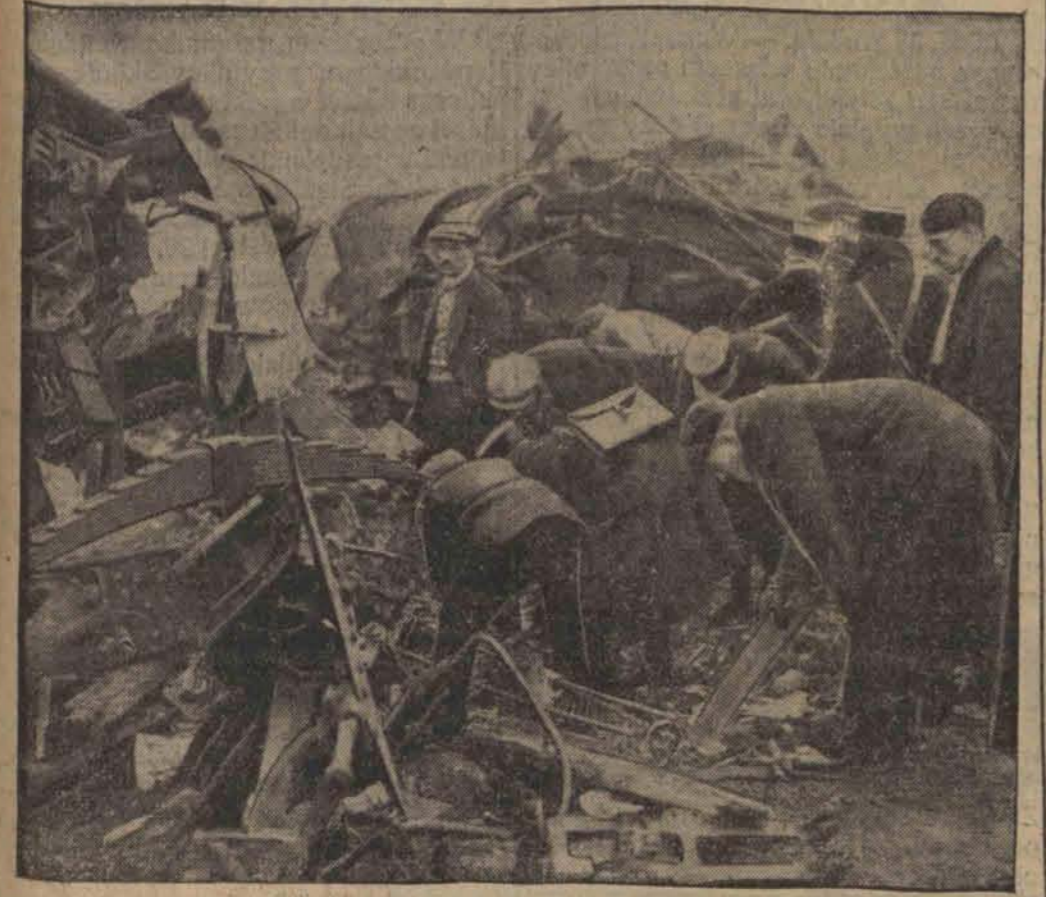
Na miejscu wielkiej katastrofy kolejowej, w której zginęło zgóra 200 osób, komisja bada przyczyny zderzenia się pociągów. Na zdjęciu komisja, badająca rozrzucone i pogruchołane części wagonów.

kińskie zdobyły fort Mamao-Czakmen, który został ewakuowany przez 19-tą dywizję. Nankińskie okręty wojenne oparowały również fort Pağoda, koło Czangczau. Załoga, złożona z oddziałów 19-cj dywizji wycofała się do Fuczau. Jak wiadomo, 19-ta dywizja, która odznaczyła się w walkach z Japończykami pod Szanghajem i uzyskała miano żelaznej dywizji, stanowi podstawę sił zbrojnych rewolucyjnego rządu prowincji Fu-Kjan.