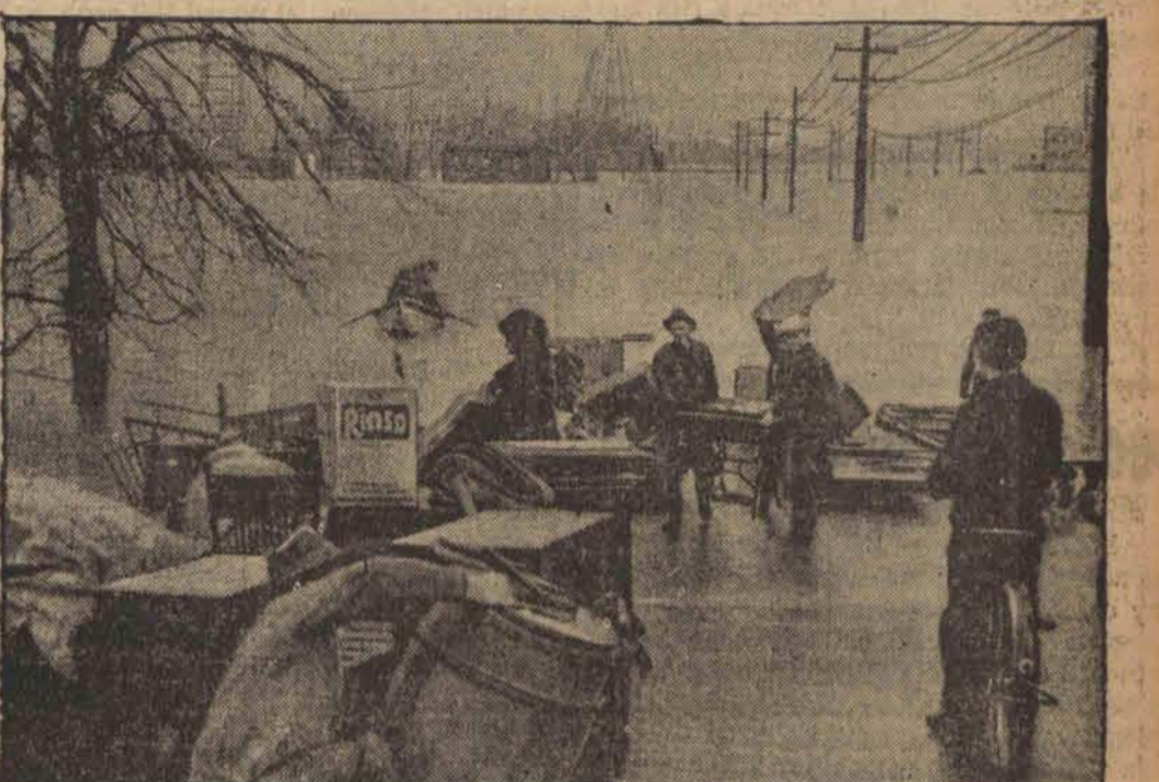
Mieszkańcy miast, leżących nad rzeką Ohio ratują resztki swego dobytku z zalanych wodą domów.