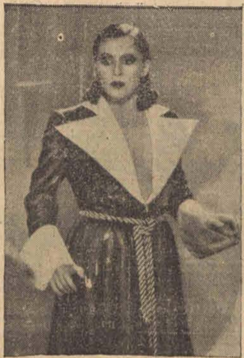
Znana aktorka szwedzka Z. Leander gra tytułową rolę w filmie „Premiera”.