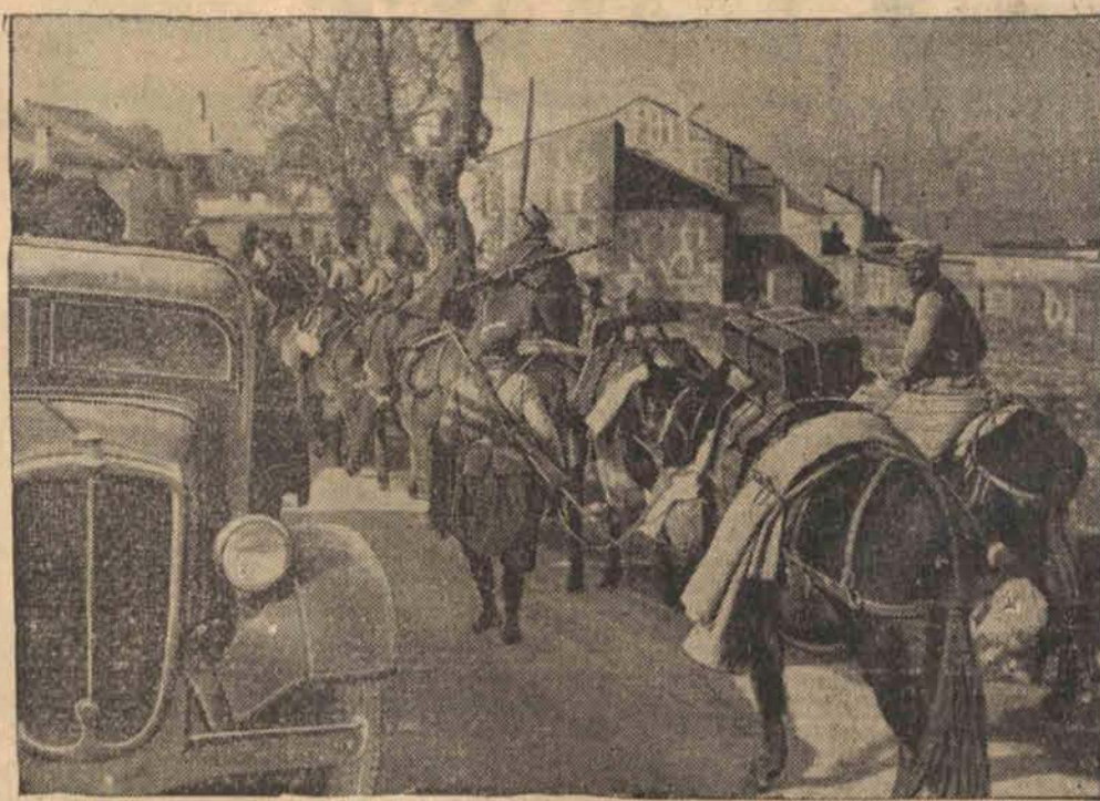
Wojska powstańcze wkraczają do zdobytego miasteczka Porcuna leżącego przy drodze wiodącej do Malagi.