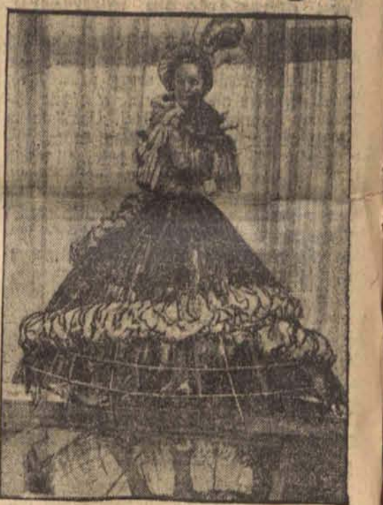
W londyńskiej rewii w Grosvenor House odżyła krynolina w nowoczesnej formie.