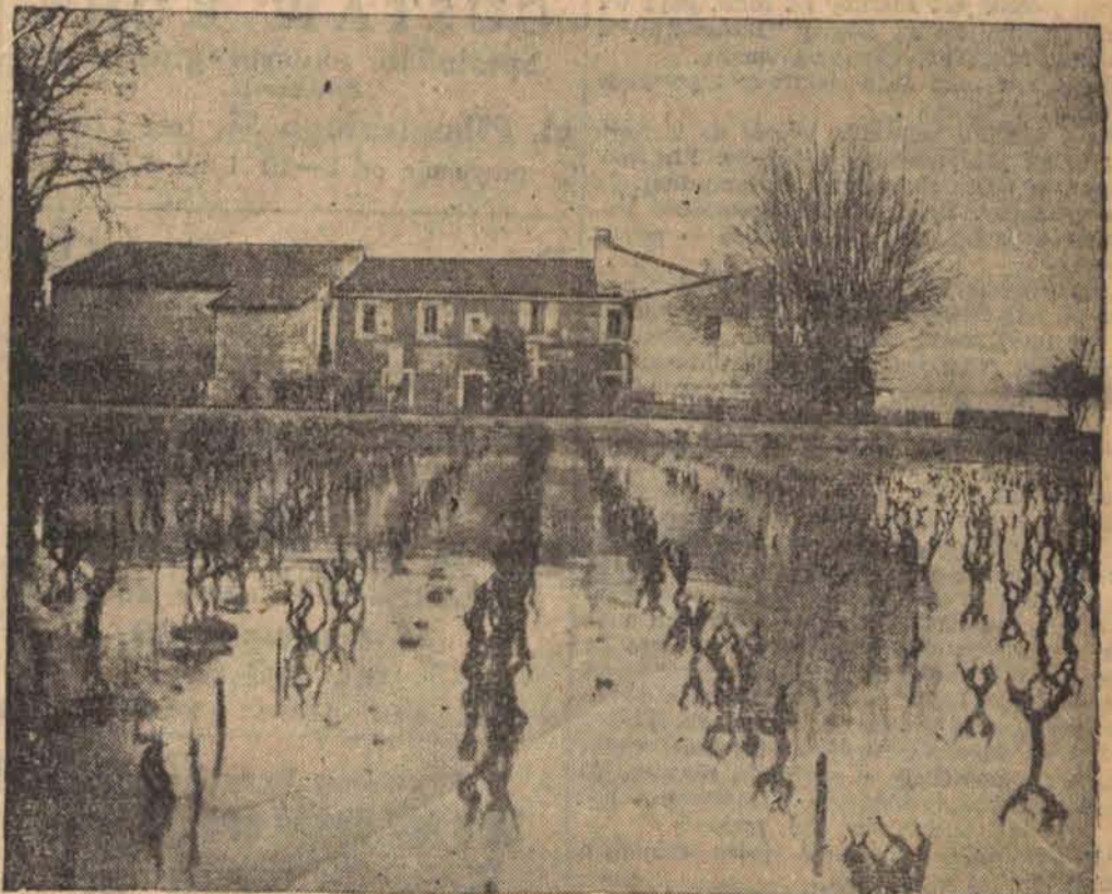
Zalane wodą wskutek groźnego wylewu Rodanu, tereny w okolicy Tarascon we Francji.