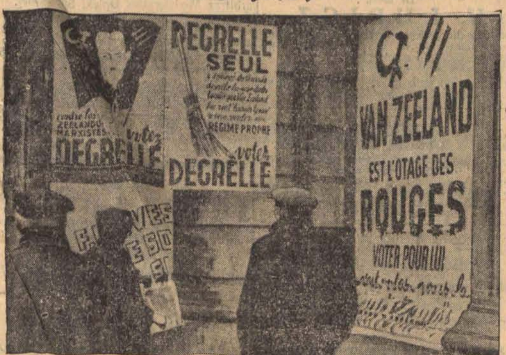
Ściany domów w Brukseli upstrzone są różnokolorowymi afiszami wyborczymi, z których jedne zalecają głosowanie na premera van Zeelanda, inne na młodego przywódcę „reżystów” — Degrelle’a