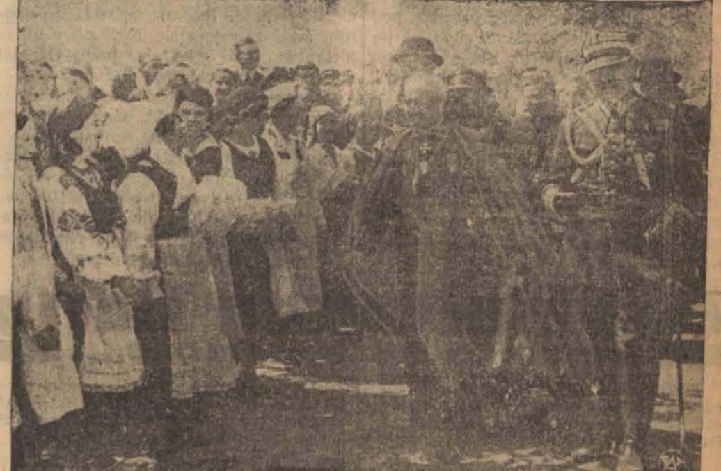
Moment, w którym Premier Składkowski w otoczeniu ministrów Poniatowskiego i Zyndram-Kościałkowskiego, oprowadzany przez ks. prałata Bizińskiego, udaje się wśród szpalerów ludności na uroczystość otwarcia wystawy.