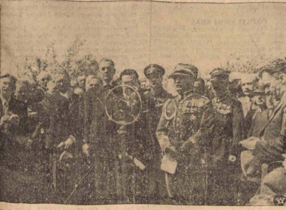
Premier Składkowski przed mikrofonem, w momencie wygłaszania przemówienia. Za mikrofonem Wojewoda Hauke Nowak.

karskiej oraz wszczęto natychmiastowe dochodzenie celem ustalenia tożsamości zabitego. Zachodzi przypuszczenie, że denat, który poniósł śmierć na skutek uderzeń o żelazne wiązania mostu, na co wskazują krwawe ślady, był jednym z „węglokradów”, który brawurowo dostanie się z wiązań mostu na będący w biegu pociąg — przyplacił śmiercią.