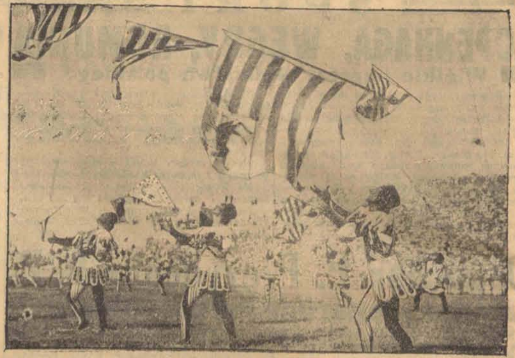
Jeden z klubów włoskich urządził efektowny pokaz rzucania chorągiewkami.