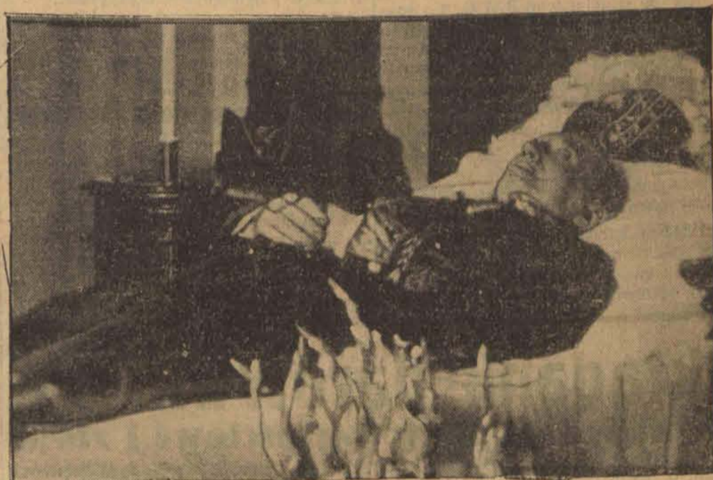
Zwłoki wielkiego wynalazcy, Guglielma Marconiego zostały wystawione na widok publiczny w gmachu włoskiej akademii królewskiej nauk.